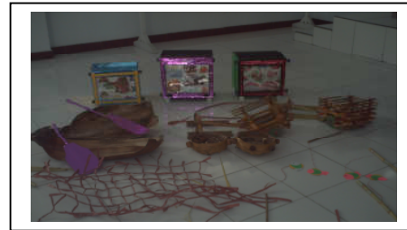
TAHAP PEMBELAJARAN MENGGUNAKAN APE YANG TELAH DIBUAT SEBELUMNYA