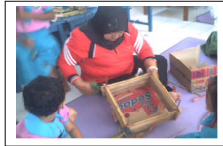
PEMBUATAN APE DAN PRODUK APE