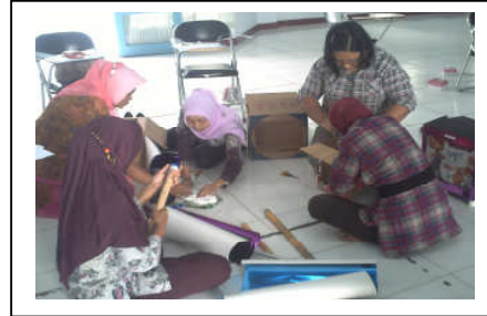
TAHAP PEMBUATAN APE DAN PRODUK APE