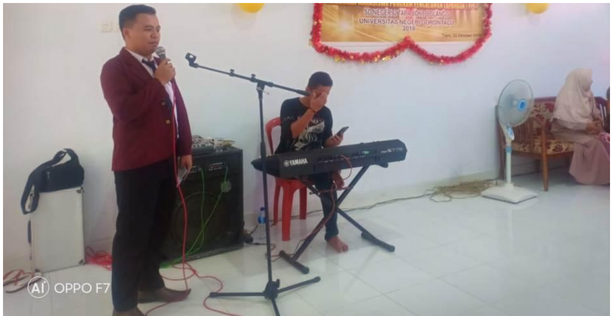
Master of Ceremony Membawa Acara Kegiatan PPM