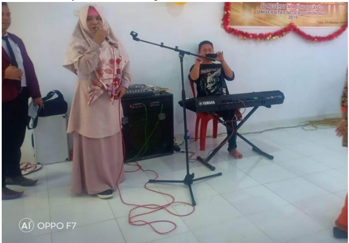
Sambutan Kepala Sekolah atas Kegiatan PPM