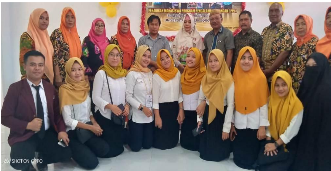
Dosen Pelaksana PPM, Kepala Sekolah, Guru dan Mahasiswa Berpose Bersama