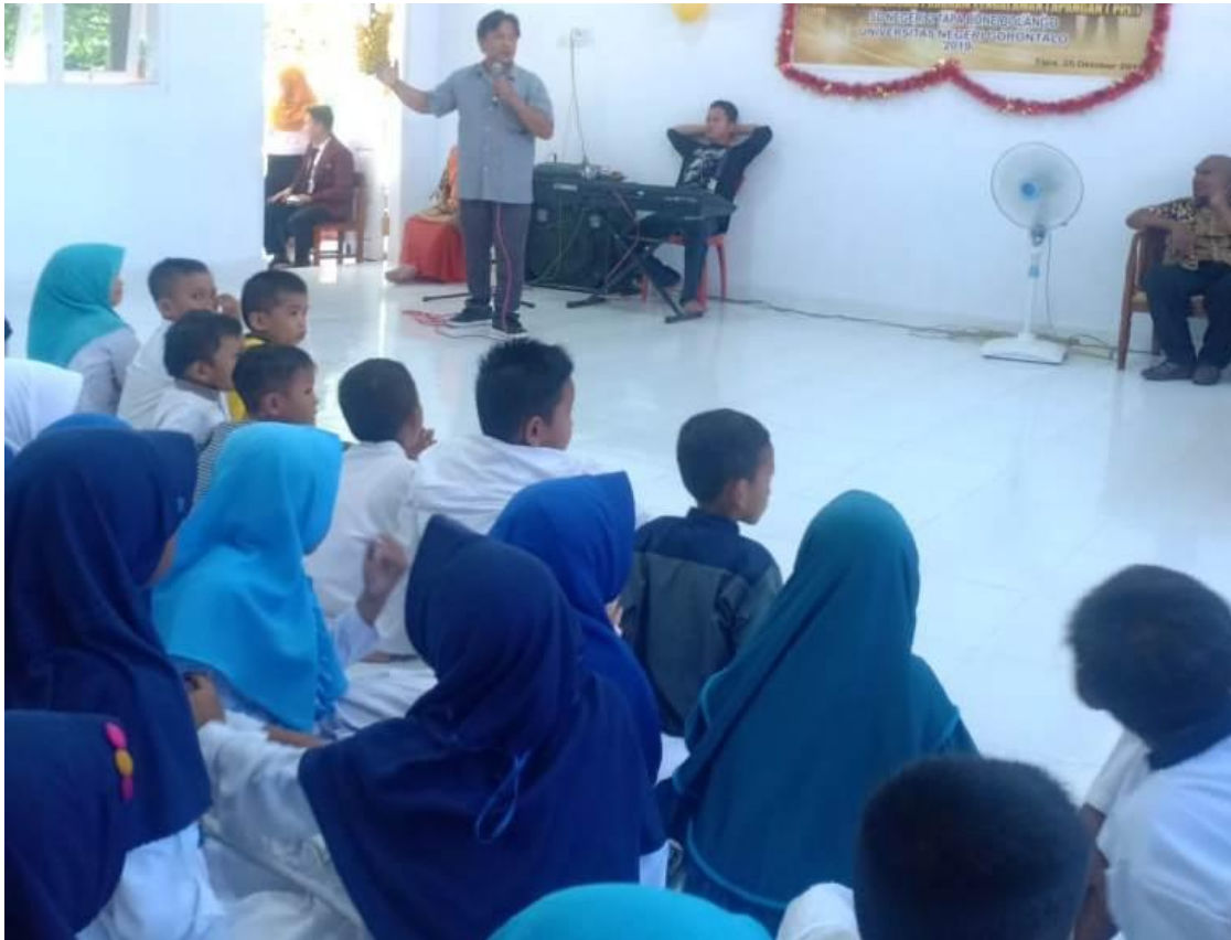
Pemberian Materi oleh Dosen Pelaksana PPM