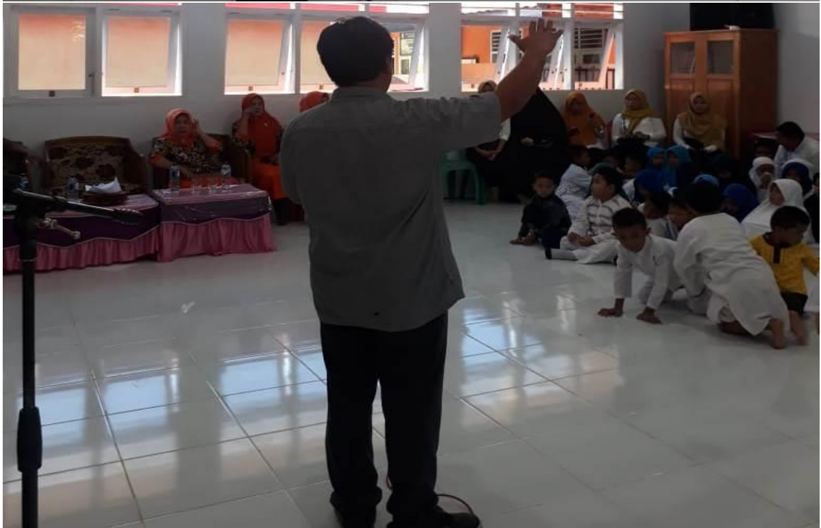
Pemberian Materi oleh Dosen Pelaksana PPM