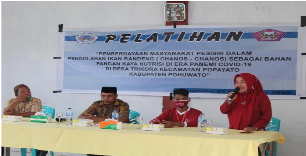
Foto Kegiatan Pelaksanaan Program Inti Desa Trikora Kecamatan Popayato