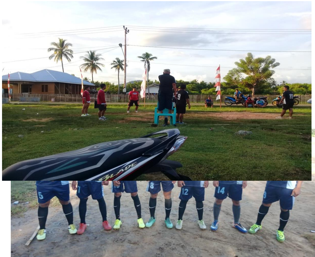
Foto Kegiatan Pelaksanaan Program Tambahan (Olahraga dan Kesenian)

Untuk mencapai tujuan dari kegiatan KKN-Tematik Tahun 2020 di Desa Trikora Kecamatan Popayato Kabupaten Pohuwato maka mahasiswa KKN-Tematik Universitas Negeri Gorontalo Melaksanakan beberapa kegiatan Tambahan yaitu kegiatan Olahraga dan Pentas seni