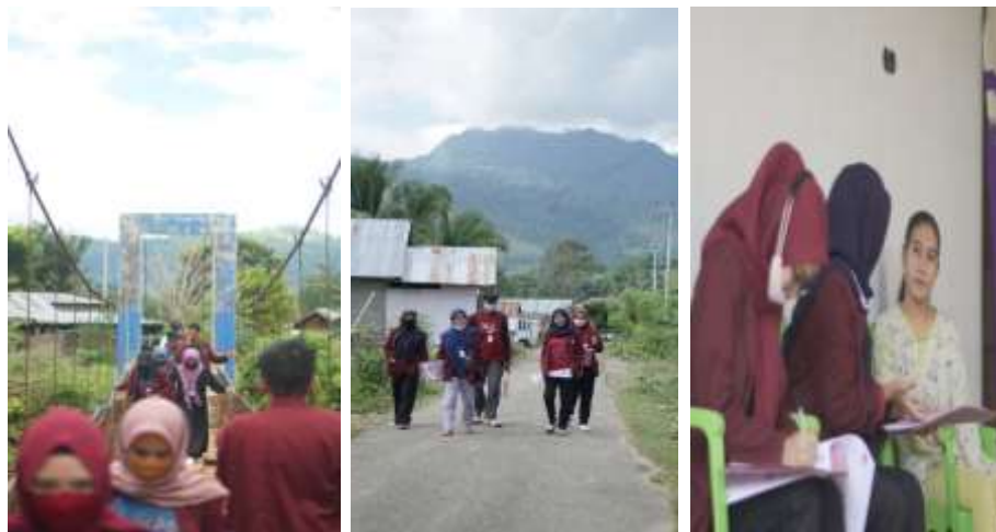
Gambar 1 Tim KKN Tematik 2020 Desa Bulontio Timur Melakukan Survei

Survei lokasi dimaksudkan untuk mendapatkan informasi potensi Desa Bulontio Timur. Survei ini dilaksanakan pada tanggal 4 September 2020 (hari kedua di lokasi). Peserta KKN tematik melakukan observasi di beberapa titik lokasi di Desa Bulontio Timur dan juga melakukan wawancara bebas pada beberapa warga Desa Bulontio Timur.