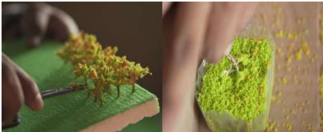
Gambar 5 Proses pembentukan miniatur pohon dengan menggunakan serbuk pohon

Selanjutnya tim mulai membuat ornamen dan objek-objek yang ada di dalam maket seperti miniatur pohon, gasebo pemancingan ikan, bangunan toilet, rangka untuk aquaponik dan lain-lain. Dalam pembuatan objek-objek tersebut, penentuan ukurannya disesuaikan dengan alas (dasar maket) yang telah di skalakan 1:100 dengan ukuran asli di lapangan.