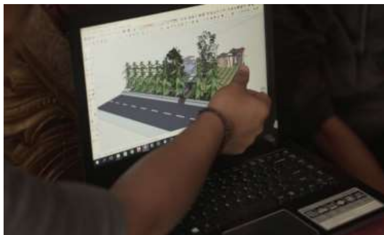
Gambar 2 Proses Desain Konsep Wisata Hortikultura/aquaponik dengan menggunakan software sketchap

Desain konsep wisata hortikultura/aquaponik terintegrasi diawali dengan mengukur luas area “green house” milik PKK Desa Bulontio Timur yang akan dijadikan pilot proyek. Hasil pengukuran tersebut menjadi dasar untuk menentukan proporsi dan peletakan posisi objek-objek yang ada dalam desain. Desain dilakukan dengan bantuan software sketchap untuk windows yang menghasilkan tampilan animasi tiga dimensi.