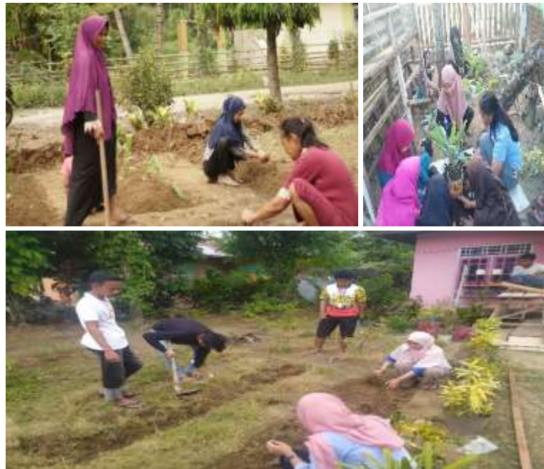
Gambar 12 Mahasiswa KKN bersama masyarakat melakukan penanaman Toga