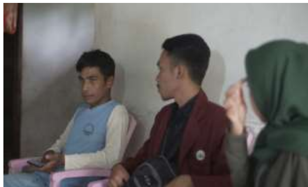
Gambar 11 Sosialisasi dan edukasi manfaat toga ke dusun-dusun di Ddesa Bulontio Timur

Untuk mewujudkan tanaman toga di dusun-dusun, tim pendamping masing-masing dusun mengawali dengan penyuluhan tanaman toga di dusun masing-masing. Selanjutnya tim tersebut mendampingi masyarakat hingga toga tersebut terwujud di tiap dusun di Desa Bulontio Timur. Periode lomba toga dimulai pada tanggal 14 September 2020 sampai pada tanggal 18 Oktober 2020. Penyerahan hadiah dilaksanakan pada malam ramah tamah KKN Tematik 2020 Desa Bulontio Timur.