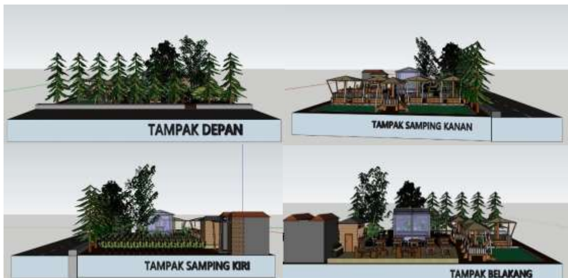
Gambar 4 Desain Konsep Wisata Hortikultura/Aquaponik teintegrasi tampak samping, depan dan belakang