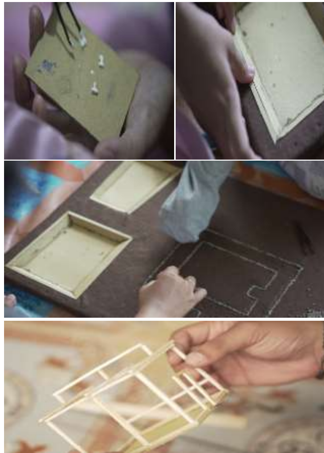
Gambar 6 Pembuatan komponen hard pada maket

Setelah ornamen dan objek-objek dalam maket telah jadi, selanjutnya tim menggabungkan ornamen dan objek-objek tersebut pada alas (dasar maket). Hasil penggabungan tersebut dapat dilihat pada gambar berikut: