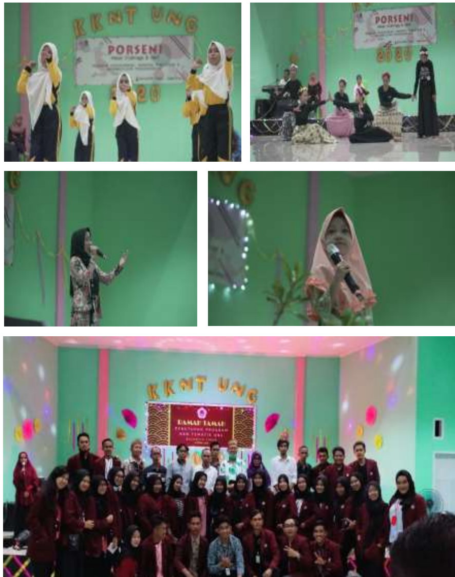
Gambar 14 Lomba Seni sebagai program Tambahan Mahasiswa KKN Desa Bulontio Timur 2020