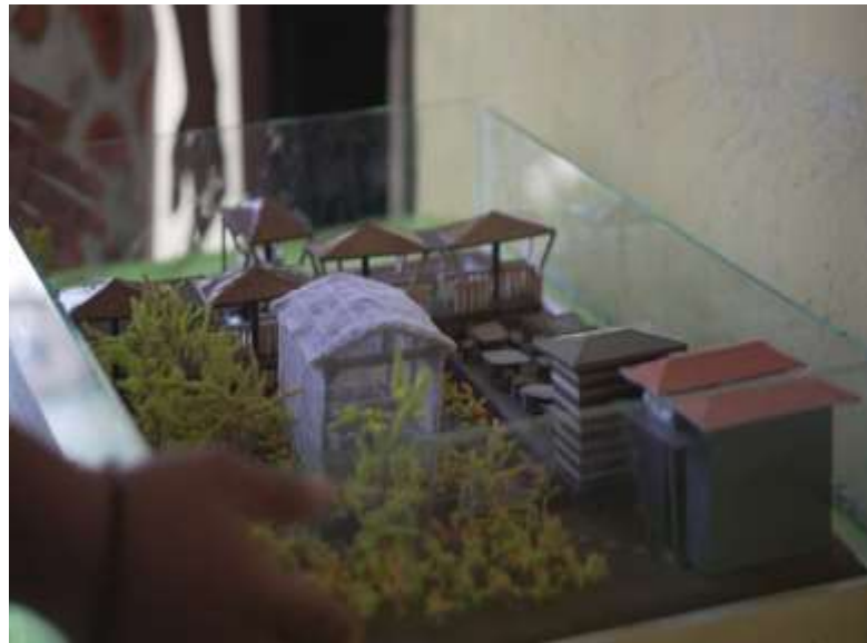
Gambar 8 tahap akhir pembuatan maket dengan memberi frame kaca

Penyerahan maket kepada pemerintah Desa Bulontio Timur dilakukan pada malam ramah tamah penutupan Program Kerja KKN Tematik UNG pada tanggal 18 Oktober 2020.