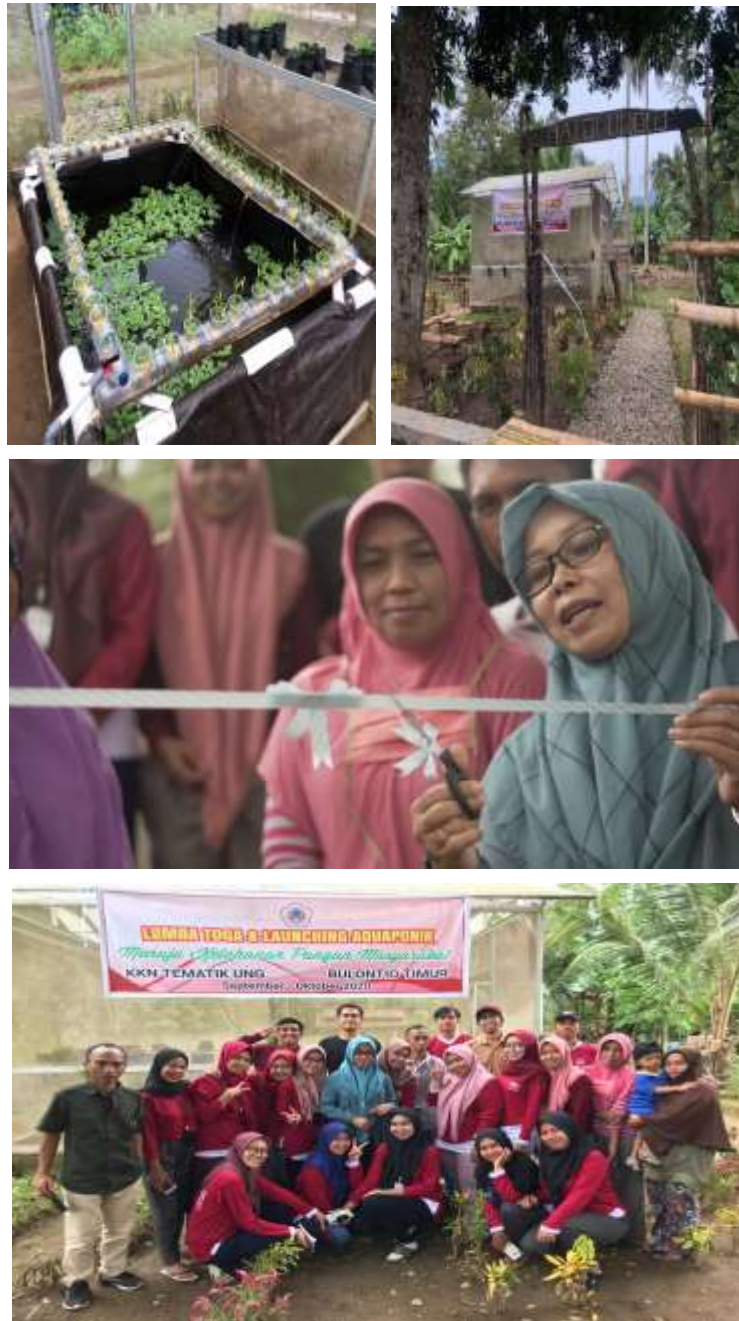
Gambar 10 Lounching Aquaponik (green house)

untuk dijadikan sebagai pilot proyek wisata hortikultura/aquaponik. Area ini adalah sebidang tanah yang berada di Dusun Kanto milik PKK Desa Bulontio Timur.