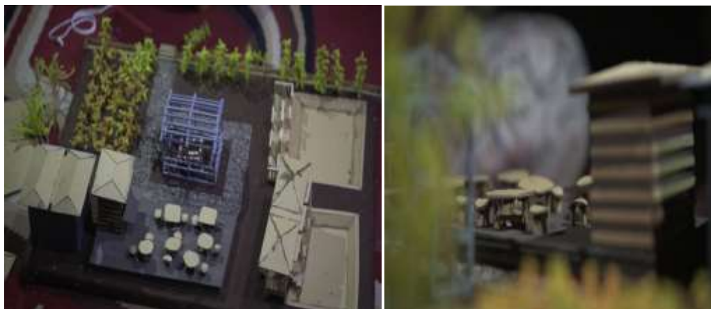
Gambar 7 Ornamen dan objek digabung pada alas (dasar maket)

Setelah ornamen dan objek-objek dalam maket telah jadi, selanjutnya tim menggabungkan ornamen dan objek-objek tersebut pada alas (dasar maket). Hasil penggabungan tersebut dapat dilihat pada gambar berikut: