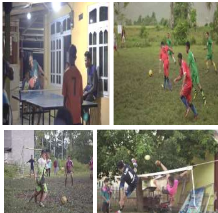
Gambar 13 Lomba olahraga tenis meja, sepak bola dan takrow

Pertandingan sepak bola, takraw dan tenis meja direncanakan dimulai pada tanggal 01 Oktober- 10 Oktober 2020. Untuk tim sepak bola terdiri dari 7 tim yaitu terdiri dari satu tim dari desa tetangga, dan enam tim dari Desa Bulontio Timur. Kompetisi sepak bola dan takraw dimulai dari ba'da ashar sampai pukul 17.00 WITA, sedangkan pertandingan tenis meja dimulai dari ba'da isya sampai pukul 22.00 WITA.