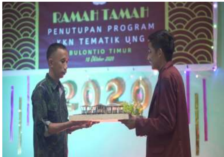
Gambar 9 Penyerahan Konsep Wisata Hortikultura/Aquaponik oleh mahasiswa KKN UNG kepada pemerintah Deda Bulontio Timur

Penyerahan maket kepada pemerintah Desa Bulontio Timur dilakukan pada malam ramah tamah penutupan Program Kerja KKN Tematik UNG pada tanggal 18 Oktober 2020.