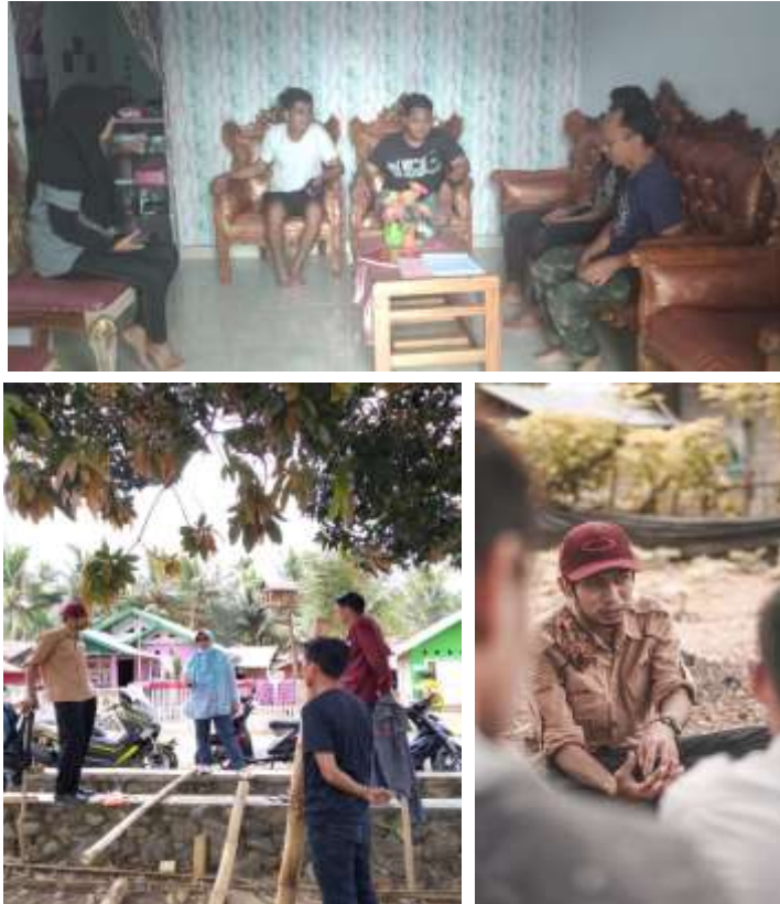
Gambar 15 Monitoring dan Evaluasi oleh Tim DPL KKN Tematik 2020 Desa Bulontio Timur

Monitoring dan evaluasi oleh tim DPL dengan cara berkunjung langsung ke lokasi dilakukan pada tanggal 9 September 2020 dengan surat tugas no 551/UN47.DI/PM.00.03/202 dan pada 7 oktober 2020 dengan surat tugas no 677/UN4.D1/PM.00.03/2020.