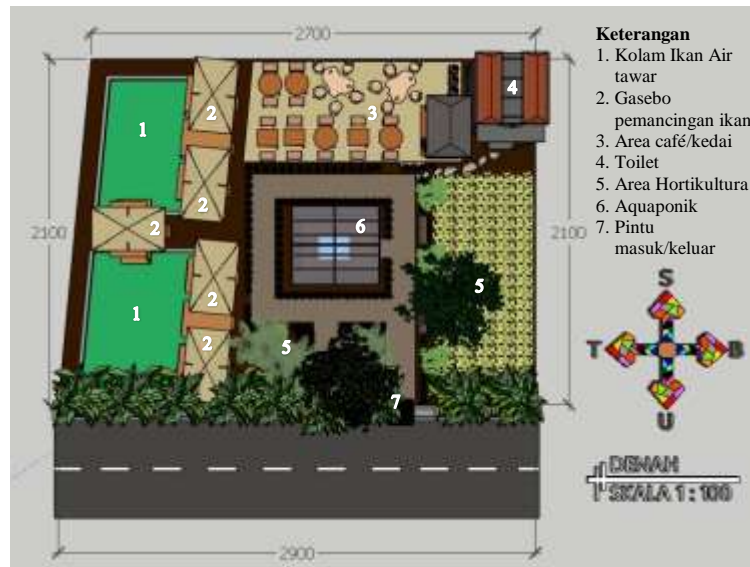
Gambar 3 Desain Konsep Wisata Hortikultura/aquaponik terintegrasi

Secara detail, berikut ini adalah hasil desain konsep wisata hortikultura/aquaponik terintegrasi.