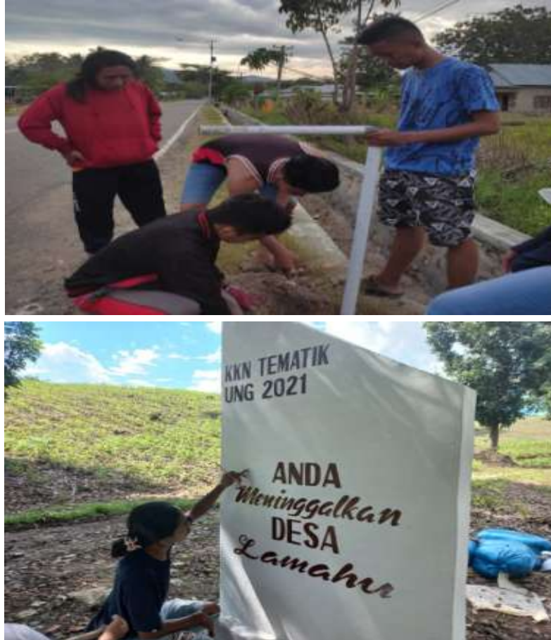
Gambar 12: Pembuatan Batas Desa di setiap Dusun, Desa Lamahu

pembangunan desa. Batas desa ini dilakukan sebagai upaya untuk memaksimalkan kegiatan desa.