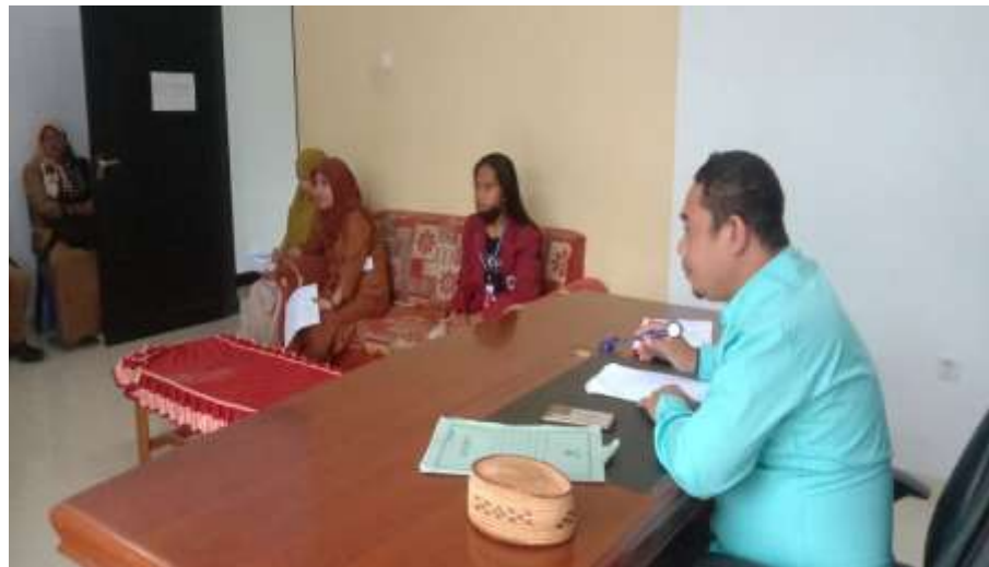
Gambar 4: Pemaparan Program Inti dan Program Tambahan Mahasiswa KKN Membangun dengan Aparat Desa dan Karang Taruna

Dalam kegiatan ini, mahasiswa berdiskusi dengan aparat desa dan karang taruna kiranya program tambahan apa saja yang dapat dilakukan oleh mahasiswa KKN untuk bisa memberikan penguatan terhadap pengembangan desa dan mengimbangi program inti yang akan dilaksanakan oleh mahasiswa KKN selama di lokasi KKN. Terlebih lagi, kegiatan tambahan yang akan dilaksanakan oleh mahasiswa dalam pengembangan desa Lamahu.