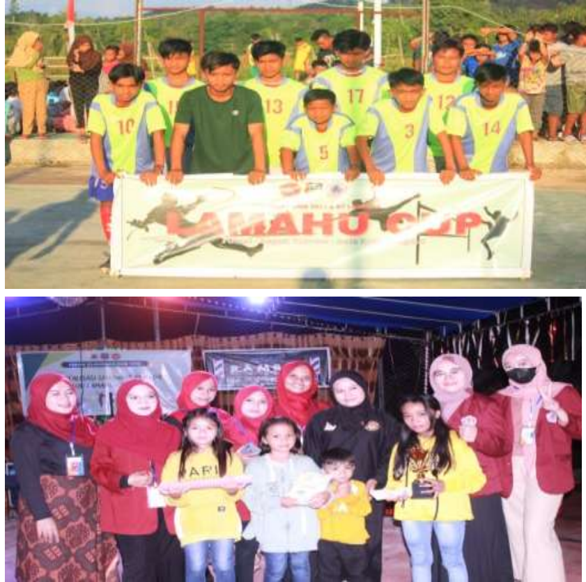
Gambar 13: Kegiatan Lamahu Cup dan Lamahu Gemilang

masyarakat dan karang taruna sehingga dapat mencapai SDGs desa yang mendukung program karang taruna.