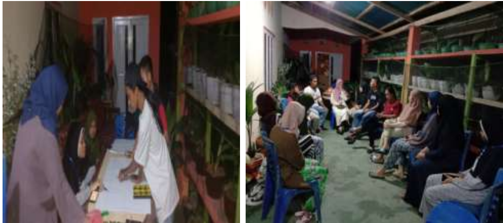
Gambar 3: Rapat Internal Mahasiswa KKN

Gambar di atas merupakan tahapan kegiatan yang dilakukan oleh mahasiswa untuk mendiskusikan kegiatan inti yang akan diselenggarakan di desa. Dalam waktu yang bersamaan, koordinasi juga telah dilakukan oleh Kordes Lamahu dengan mahasiswa lainnya untuk membahas kegiatan inti yang akan dilaksanakan di Desa Lamahu.