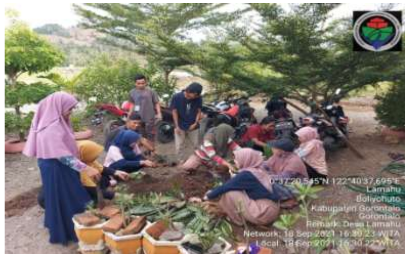
Gambar 9: Penanaman Lidah Mertua oleh Mahasiswa KKN

Tertanggal 21 September 2021, mahasiswa KKN Tematik Membangun di Desa Lamahu telah melakukan kegiatan penanaman lidah mertua dengan masyarakat sekitar sebagai upaya penghijauan di lokasi KKN. Hal ini sebagai bentuk dukungan pada program membangun desa di bidang pembangunan desa yang mendukung kegiatan SDGs desa.