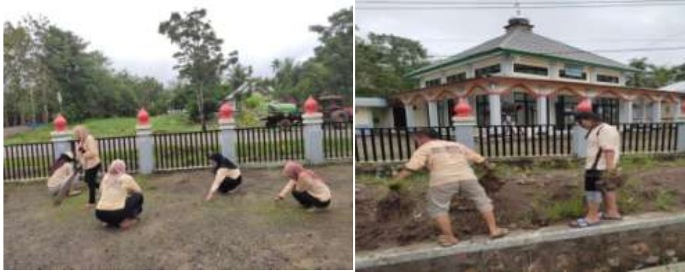
Gambar 6: Kerjabakti di Desa Lamahu, Kecamatan Bilato

Kerja bakti yang telah dilakukan oleh mahasiswa KKN pada umumnya dilaksanakan pada beberapa titik diantaranya Mesjid terdekat di Desa Lamahu, Kec. Bilato, Kab. Gorontalo. Kerja bakti ini sebagai upaya untuk melaksanakan SDGs Desa Lamahu pada bidang pemberdayaan masyarakat, khususnya menyelenggarakan kegiatan jumat bersih bagi masyarakat sekitar.