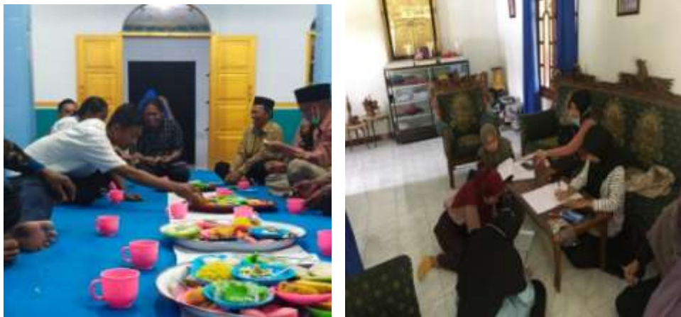
Gambar 5: Persiapan Mahasiswa KKN terkait Program Inti dan Program Tambahan melalui Silaturahmi dengan Masyarakat, Desa Lamahu, Kecamatan Bilato

Tertanggal 17 September 2021, mahasiswa KKN mulai menyiapkan program yang akan dilaksanakan. Dalam kesempatan yang bersamaan pula, mahasiswa KKN ini mulai silaturahmi dengan masyarakat desa Lamahu dalam menyiapkan sistem keterlaksanaan program desa di desa Lamahu berupa inovasi digitalisasi, program SDGs lainnya. Bentuk persiapan ini tidak terlepas dari informasi yang didiskusikan dengan DPL terkait apa saja yang dapat disiapkan oleh mahasiswa dalam program inti.