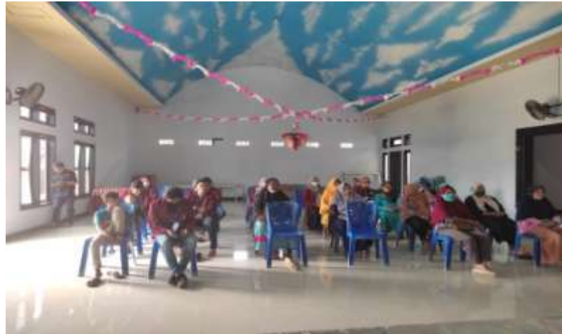
Gambar 10: Sosialisasi Covid 19 dan Bantuan PKH