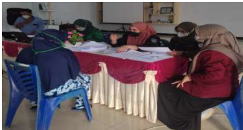
Gambar 7: Survey Kebutuhan Pelaku Usaha di Desa Lamahu

Survey kebutuhan pelaku usaha dalam bidang pemasaran usaha telah dilakukan oleh mahasiswa KKN sebagai upaya dalam mengetahui tingkat kebutuhan masyarakat dalam memasarkan usaha yang telah digeluti. Hasil analisis kebutuhan ini akan berimbas pada pelatihan digitalisasi bagi pelaku usaha yang membutuhkan sistem pemasaran digitalisasi.