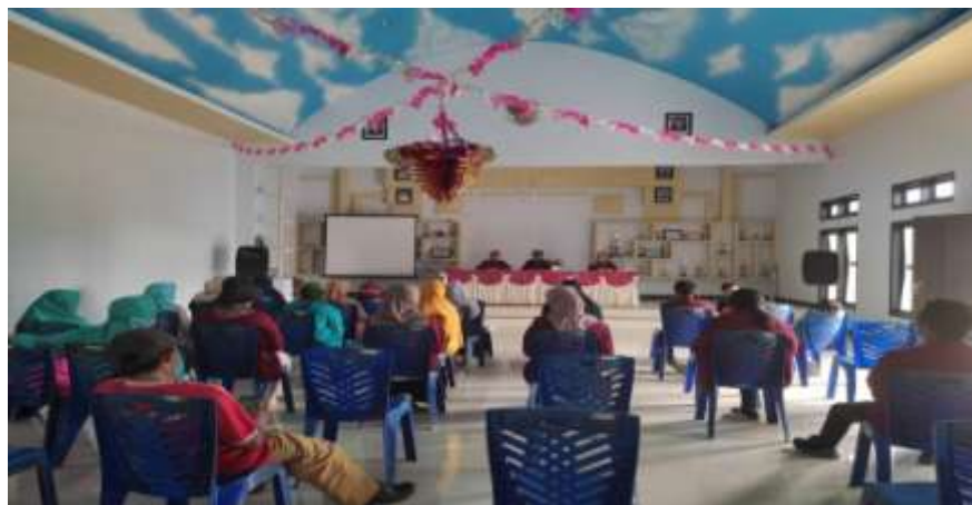
Gambar 8: Pelatihan Digitalisasi bagi Pelaku Usaha di Desa Lamahu, Kec. Bilato

Digitalisasi program UKM di Desa Lamahu merupakan salah satu program inti yang dilakukan oleh mahasiswa KKN di lokasi KKN pada umumnya. Pada program ini, mahasiswa memberikan pelatihan bagi pelaku usaha UKM untuk memasarkan usahanya secara online sehingga memudahkan dalam proses promosi dan penjualan barang. Kegiatan ini bertujuan untuk mendapatkan respon positif dari masyarakat sekitar sebagai upaya dalam meningkatkan peranan masyarakat dan tentunya mendukung program SDGs Desa Lamahu dalam bidang pembangunan desa, yang merujuk pada pemerataan ekonomi masyarakat.