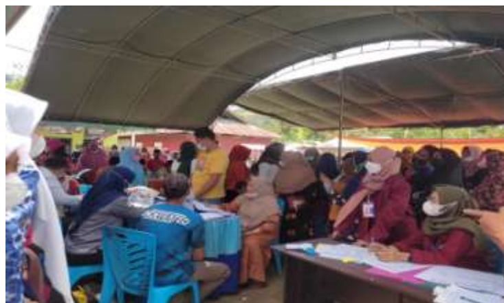
Gambar 11: Kegiatan Vaksinasi di Desa Lamahu

Tertanggal 28 September 2021 mahasiswa KKN didampingi oleh aparat desa melaksanakan giat vaksinasi bagi masyarakat yang belum divaksin. Hal ini sebagai upaya dalam mencegah penyebaran covid 19 di Desa Lamahu. Bentuk digitalisasi yang direalisasikan pada kegiatan ini dapat dilakukan melalui pendataan data base melalui data lindung kesehatan yang dipergunakan untuk melacak masyarakat yang telah divaksin di desa Lamahu.