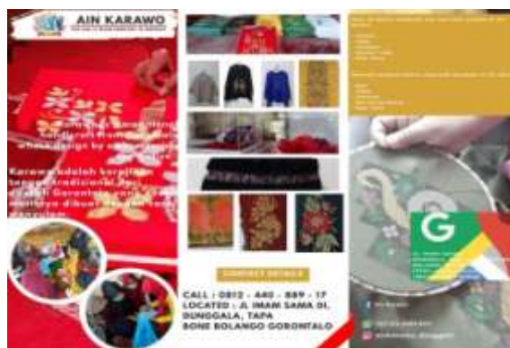
Gambar 8: Output Pemasaran Produk UKM dalam Bentuk Brosur