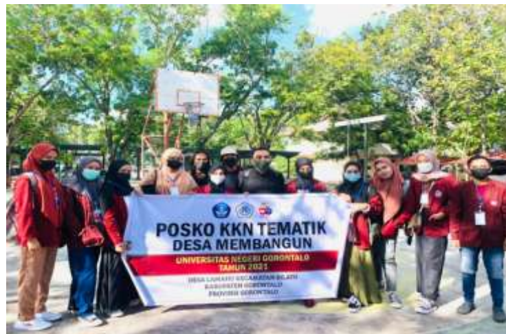
Gambar 1: Keberangkatan Mahasiswa KKN Membangun Di Desa Lamahu, Kecamatan Bilato, Kab. Gorontalo

Tepatnya pada hari Rabu, 15 September 2021, keberangkatan mahasiswa KKN Tematik Membangun berkumpul dan diarahkan oleh dosen pembimbing lapangan di lapangan indoor UNG untuk pengecekan persiapan dan kelengkapan mahasiswa untuk menuju lokasi KKN.