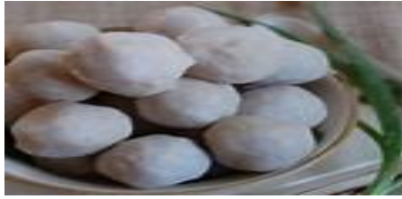
Gambar 2. Bakso Ikan

Pembentukan adonan menjadi bola-bola bakso dapat dilakukan dengan menggunakan tangan atau dengan mesin pencetak bola bakso. Jika memakai tangan, caranya mudah; adonan diambil dengan sendok makan lalu diputar-putar dengan tangan sehingga terbentuk bola bakso. Bagi orang yang telah mahir, untuk membuat bola bakso ini cukup dengan mengambil segenggam adonan lalu diremas-remas dan ditekan ke arah ibu jari. Adonan yang keluar dari ibu jari dan telunjuk membentuk bulatan lalu diambil dengan sendok.