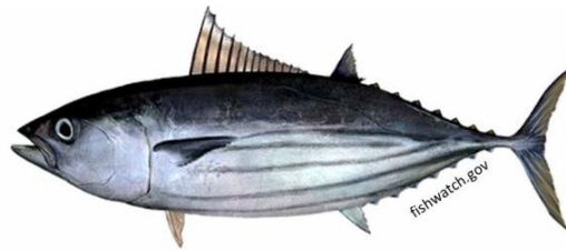
Gambar 1. Ikan Cakalang ( Katsuwonus pelamis )

Ikan cakalang ( Katsuwonus pelamis ) merupakan salah satu hasil perikanan tangkap yang dominan di wilayah pesisir. Desa Lobuto adalah desa yang mayoritas masyarakatnya bermata pencaharian sebagian besar nelayan dan berada pada wilayah pesisir pantai.