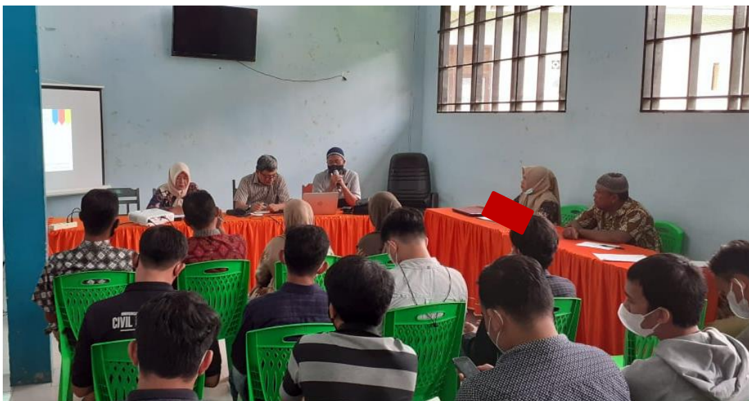
Gambar 5.1. Kegiatan Sosialisasi