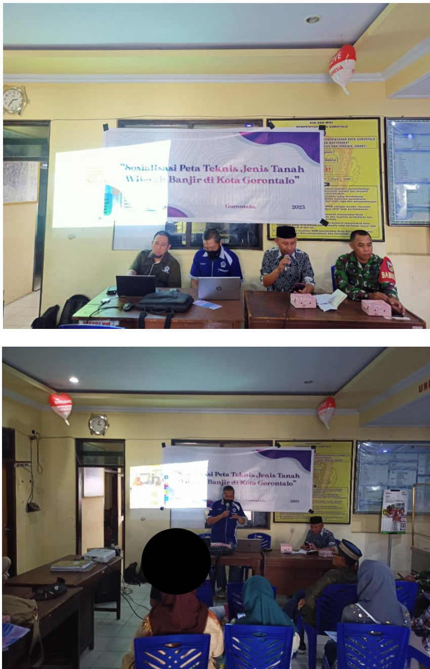
Gambar 5.1. Kegiatan Sosialisasi

Kegiatan yang dilaksanakan pada program pengabdian mandiri ini berupa pendampingan kepada masyarakat Kelurahan Ipilo Kota Gorontalo agar mengetahui jenis tanah penyebab banjir di wilayahnya masing-masing. Adapun hasil pelaksanaan kegiatan tersebut diuraikan sebagai berikut: