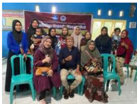
4.2 Foto Bersama