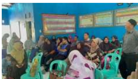
Gambar 4.1 Peserta Pengabdian

Berdasarkan data di lapangan Nampak bahwa para peserta kegiatan pelatihan sangat memahami penjelasan materi yang disampaikan. Hal ini dibuktikan dengan berbagai macam pertanyaan yang diajukan serta diskusi. Namun masih memerlukan pembinaan dengan cara pendampingan lebih lanjut terkait penyusunan laporan keuangan dan bisa dengan menggunakan aplikasi seperti SI APIK, mengingat pelatihan ini terkait pengetahuan akuntansi sehingga diharapkan peserta memahami fungsi masing-masing akun dalm laporan keuangan.