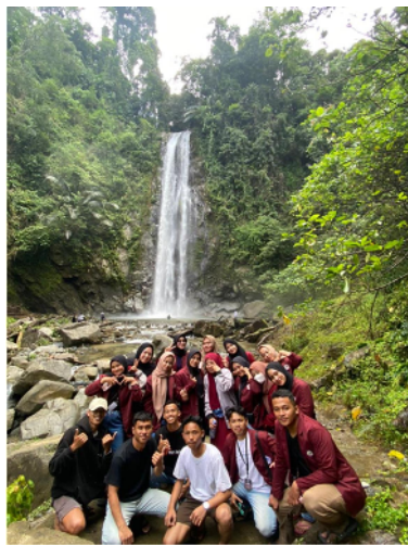
Gambar 31. Foto bersama setelah survei produk Spot Foto di lokasi air terjun

Kegiatan mahasiswa KKN dalam bidang kerohanian Islam adalah membimbing mengaji anak-anak Desa Ilohuuwa di Masjid As-Shabirin dusun 1 Mekar Jaya.