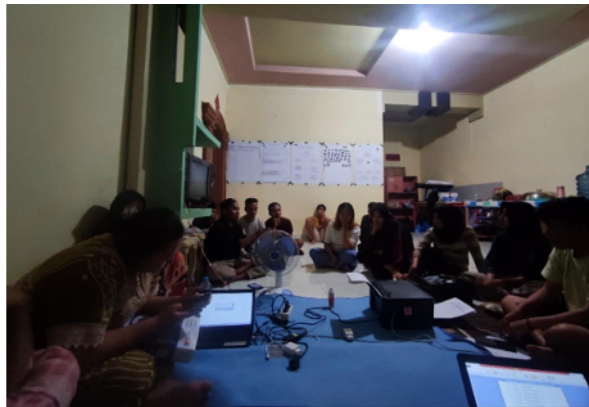
Gambar 12. Membuat program kerja setelah observasi di lingkungan Desa Ilohuwa

Setelah mengetahui gambaran kondisi Desa Ilohuwa, Mahasiswa KKN mengadakan rapat evaluasi untuk menentukan jenis-jenis kegiatan yang akan dilakukan selama KKN di desa Ilohuwa.