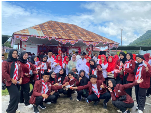
Gambar 17. Foro bersama Ayahanda Ilohuwa dengan mahasiswa KKN

Perayaan hari kemerdekaan 17 Agustus dihadiri oleh seluruh mahasiswa KKN sekecamatan Bone yang bertempat di Ruang Terbuka Hijau depan kantor Kecamatan. Selesai upacara melakukan foto bersama kepala desa Ilohuwa bersama dengan ibu.