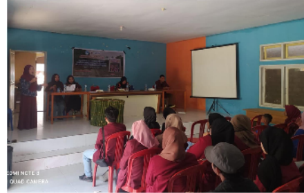
Gambar 1. DPL menjelaskan langkah kerja pembuatan Spot Foto

Desa Ilohuwa yang memiliki tempat Wisata Air Terjun Hulia mempunyai banyak peluang untuk dimanfaatkan sebagaimana mestinya. Berdasarkan hal tersebut, peranan lembaga pendidikan seperti UNG menjadi penting untuk menumbuhkan jiwa kreatifitas masyarakatnya melalui kegiatan Kuliah Kerja Nyata (KKN). Bentuk kegiatan inti yang dilakukan Mahasiswa KKN bersama dengan DPL adalah pembuatan Spot Foto di lokasi yang memiliki peluang dikunjungi. Langkah awal kegiatan adalah mendata peserta pelatihan berjumlah 20 orang yang terdiri dari masyarakat produktif. Pelatihan dilaksanakan pada hari Minggu tanggal 13 Agustus 2023. Kegiatan pemberian materi pelatihan bertempat di Aula Kantor Desa Ilohuwa.