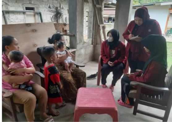
Gambar 11. Observasi di lingkungan desa Ilohuwa

Mahasiswa KKN Desa Ilohuwa membagi tugas berkelompok dengan mendatangi masyarakat untuk memperoleh informasi mengenai potensi-potensi yang dapat dilakukan Mahasiswa KKN. Melalui survei itu juga mahasiswa sekaligus mensosialisasikan bentuk kegiatan inti yang akan dilaksanakan.