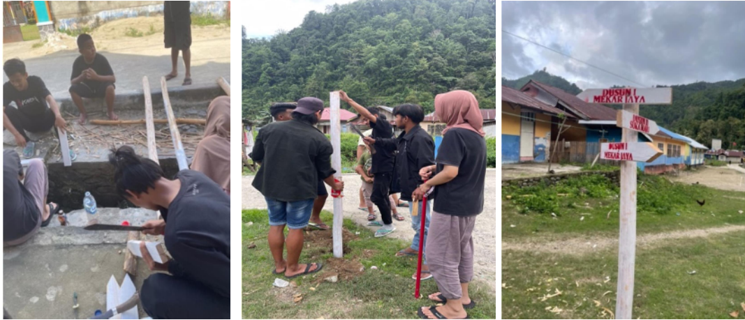
Gambar 18. Proses pembuatan batas dusun desa Ilohuuwa

Kegiatan desa lainnya yang dilaksanakan mahasiswa KKN Desa Ilohuuwa adalah pembuatan pembatas dusun. Batas dusun dibuat dengan tujuan agar masyarakat luar ataupun warga desa itu sendiri dapat mengetahui batas-batas dusun yang ada di Desa Ilohuuwa.