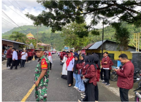
Gambar 15. Pembagian bendera menyambut hari kemerdekaan

Kegiatan lain dalam persiapan hari kemerdekaan dengan mengikuti latihan paduan suara bersama dengan seluruh Mahasiswa KKN seKecamatan Bone. Latihan paduan suara seKecamatan Bone dilaksanakan di Aula Kantor Kecamatan Taludaa.