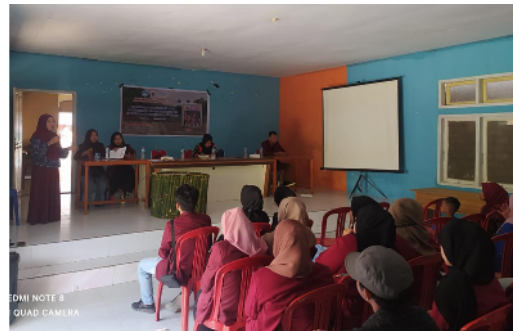
Gambar 5. DPL menjelaskan langkah kerja pembuatan spot foto di aula kantor desa Ilohuwa

Desa Ilohuwa yang memiliki tempat Wisata Air Terjun Hulia mempunyai banyak peluang untuk dimanfaatkan sebagaimana mestinya. Berdasarkan hal tersebut, peranan lembaga pendidikan seperti UNG menjadi penting untuk menumbuhkan jiwa kreatifitas masyarakatnya melalui kegiatan Kuliah Kerja Nyata (KKN). Bentuk kegiatan inti yang dilakukan Mahasiswa KKN bersama dengan DPL adalah pembuatan Spot Foto di lokasi yang memiliki peluang dikunjungi. Langkah awal kegiatan adalah mendata peserta pelatihan berjumlah 20 orang yang terdiri dari masyarakat produktif. Pelatihan dilaksanakan pada hari Minggu tanggal 13 Agustus 2023. Kegiatan pemberian materi pelatihan bertempat di Aula Kantor Desa Ilohuwa.