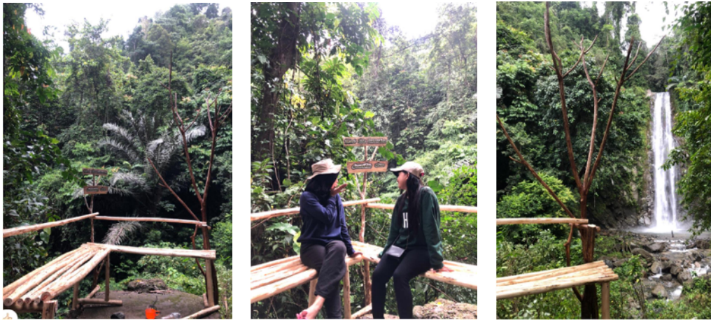
Gambar 29. Tempat duduk sebagai spot foto

Setelah memasuki gerbang masuk lokasi air terjun, jalan menuju air terjun mulai menaiki anak tangga, posisi tempat duduk yang dibuat mahasiswa KKN berada persis dipuncak sebelum menuruni anak tangga ke Air Terjun. Tempat duduk yang dibuat selain sebagai tempat singgah juga berfungsi sebagai Spot Foto.