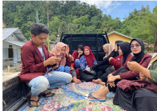
Gambar 26. Perjalanan menuju lokasi Air Terjun

tempuh menggunakan kendaraan mobil dari kantor Desa Ilohuuwa ke lokasi air terjun kurang lebih 15 menit. Setelah selesai melaksanakan kegiatan inti, DPL bersama dengan mahasiswa KKN meninjau Spot Foto yang sudah dibuat di lokasi Air Terjun Hulia. DPL dan mahasiswa KKN melakukan perjalanan menuju lokasi air terjun dengan menggunakan mobil yang sudah menjadi angkutan umum ke lokasi air terjun, sebahagian mahasiswa menggunakan kendaraan motor.