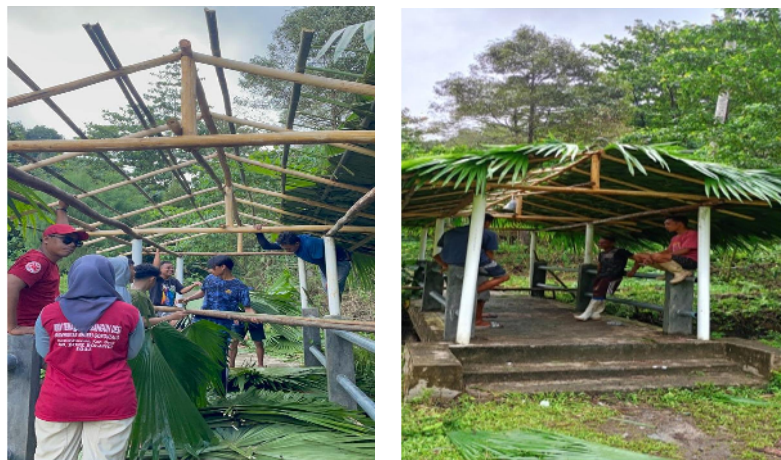
Gambar 27. Proses pembuatan gerbang masuk menuju Air Terjun Hulia

Proses pembuatan gerbang masuk menjadi penanda jalur ke lokasi Air Terjun sudah dekat. Pembuatan gerbang masuk dikerjakan mahasiswa KKN bersama dengan karang taruna Desa Ilohuuwa selama 2 minggu. Produk yang dibuat di lokasi air terjun terdiri dari 3, yaitu gerbang masuk lokasi air terjun Hulia, tempat duduk, dan taman mini. Ketiga produk yang dibuat dapat dijadikan spot foto. Gerbang masuk lokasi air terjun dapat dilihat pada gambar di bawah.