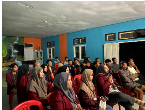
Gambar 10. Pertemuan mahasiswa KKN dengan aparat desa dan karang taruna

Kegiatan tambahan mahasiswa KKN Desa Ilohuwa mencakup bidang kegiatan desa, bidang pendidikan, olahraga dan Seni, dan kerohanian Islam. Mahasiswa memulai kegiatan di lokasi dengan mengadakan pertemuan dengan aparat desa dan karang taruna di Aula Kantor Desa pada tanggal 19 Juli 2023. Gambaran terkait dengan kondisi desa turut disampaikan pada kegiatan pertemuan sehingga mahasiswa KKN mendapat gambaran kondisi lingkungan sekitar sebelum survei atau observasi.