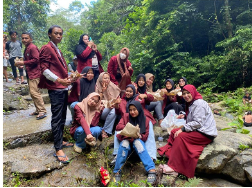
Gambar 30. Istirahat meikmati keindahan alam di lokasi air terjun