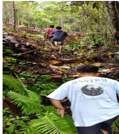
Gambar 25. Proses pencarian daun woka

Hasil diskusi mahasiswa KKN dengan tokoh pariwisata yang ada di Desa Ilohuuwa adalah perwujudan pembuatan atap pintu masuk tempat wisata air terjun Hulua dan pembuatan tempat duduk sebagai tempat istirahat menuju air terjun. Bahan-bahan yang digunakan adalah bahan yang mudah didapatkan di sekitar lingkungan Desa Ilohuuwa. Kegiatan tersebut dilaksanakan oleh mahasiswa KKN bersama dengan masyarakat dan karang taruna. Bahan utama yang digunakan membuat gerbang masuk di tempat wisata Air Terjun adalah dari bambu karna bambu banyak dan mudah didapatkan di Desa Ilohuuwa. Atap gerbang masuk menggunakan bahan yang ada di sekitar perkebunan masyarakat, yaitu daun woka .