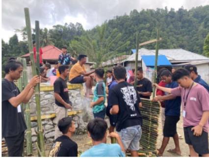
Gambar 3. Masyarakat turut serta dalam pembuatan spot foto

Hasil akhir dari pembuatan Spot Foto diharapkan dapat dikembangkan oleh masyarakat Desa Ilohuuwa dengan membuat Spot Foto lainnya yang dapat ditempatkan di lokasi yang memiliki pemandangan indah. Tujuan dari pembuatan Spot Foto adalah untuk menarik wisatawan berkunjung ke Desa Ilohuuwa yang dapat menunjang peningkatan perekonomian masyarakat dari berbagai aspek.