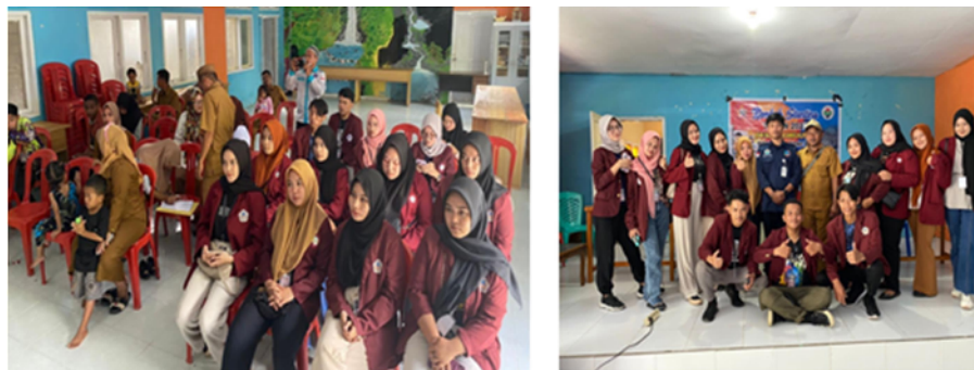
Gambar 23. Musyawarah dengan aparat desa

Kegiatan desa lainnya seperti rapat musyawarah desa, penetapan SDGs desa 2023 dan Rumbuk Stunting desa Ilohuuwa 2023.