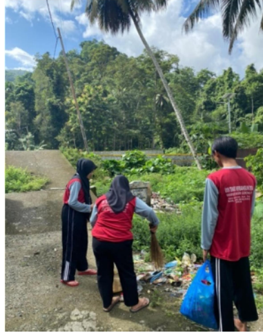
Gambar 20. Kegiatan Jumat Bersih di lingkungan terbuka

Kegiatan membersihkan lingkungan tidak hanya dilakukan di sekitar lingkungan pemukiman masyarakat tetapi juga dilakukan di sekitar tempat menuju lokasi Wisata Air Terjun Hulua yang masuk dalam wilayah Desa Ilohuwa.