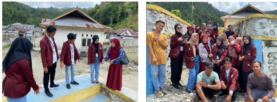
Gambar 6. Diskusi bersama peserta pelatihan dan mahasiswa KKN di lokasi penempatan spot foto di tanggul

Setelah memberikan materi pelatihan, kegiatan selanjutnya adalah menuju lokasi pembuatan Spot Foto. Lokasi Spot Foto pada tanggul yang membatasi dusun 2 dengan dusun 3. DPL bersama dengan peserta pelatihan dan mahasiswa KKN melanjutkan diskusi di lokasi penempatan spot foto yang akan dibuat.