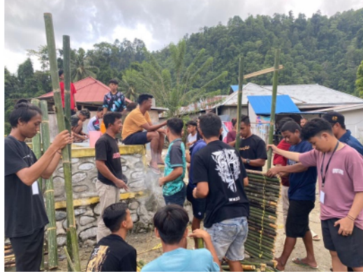
Gambar 7. Masyarakat turut serta dalam pembuatan spot foto

Kegiatan inti mahasiswa KKN mendapat dukungan dari pemerintah setempat dan masyarakat serta karang taruna. Masyarakat ikut terlibat langsung dalam pembuatan Spot Foto dari mempersiapkan bahan hingga selesai.