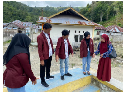
Gambar 2. Diskusi bersama Mahasiswa KKN dan DPL

Setelah memberikan materi pelatihan, kegiatan selanjutnya adalah menuju lokasi pembuatan Spot Foto. Lokasi Spot Foto pada tanggul yang membatasi dusun 2 dengan dusun 3. DPL bersama dengan peserta pelatihan dan mahasiswa KKN melanjutkan diskusi di lokasi penempatan spot foto yang akan dibuat.