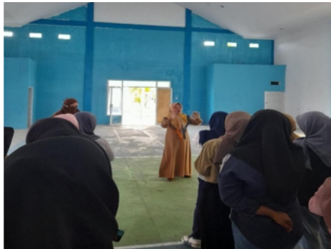
Gambar 16. Melakukan latihan paduan suara di Aula Kantor Kecamatan di Taludaa

Kegiatan lain dalam persiapan hari kemerdekaan dengan mengikuti latihan paduan suara bersama dengan seluruh Mahasiswa KKN seKecamatan Bone. Latihan paduan suara seKecamatan Bone dilaksanakan di Aula Kantor Kecamatan Taludaa.