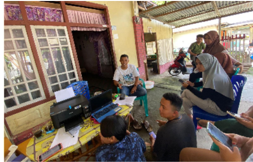
Gambar 24. Mahasiswa KKN mengadakan diskusi dengan tokoh pariwisata

lokasi air terjun, Mahasiswa KKN berdiskusi dengan tokoh pariwisata yang ada di desa Ilohuuwa.