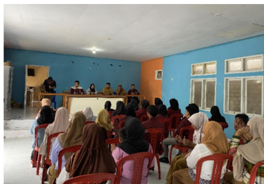
Gambar 3. Penerimaan Mahasiswa KKN di Aula Kantor Desa Ilohuwa

Perjalanan dari kampus 1 Universitas Negeri Gorontalo ke lokasi KKN Desa Ilohuwa ditempuh selama kurang lebih 2 jam. Mahasiswa KKN Desa Ilohuwa diterima oleh kepala desa dan aparat desa di Aula Kantor Desa Ilohuwa, turut hadir dalam kegiatan penerimaan mahasiswa KKN adalah ketua BPD dan perwakilan dari aparat kecamatan. Kepala desa, aparat kecamatan, ketua BPD, dan DPL memberikan sambutan pada kegiatan penerimaan Mahasiswa KKN Desa Ilohuwa. Ayahanda sebagai kepala desa Ilohuwa memberikan sambutan dengan harapan Mahasiswa KKN bisa bekerja sama dengan masyarakat dan karang taruna dalam mensukseskan program KKN UNG di Kecamatan Bone Kabupaten Bone Bolango pada umumnya.