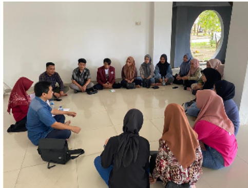
Gambar 1. Pembekalan dari DPL kepada Mahasiswa KKN UNG Desa Ilohuuwa

Mahasiswa KKN Tematik Membangun Desa diberikan pembekalan oleh Dosen Pembimbing Lapangan (DPL) tanggal 15 Juli 2023 bertempat di UPT PKM UNG pada jam 09.30 – 11.30 WITA. Kegiatan pembekalan dihadiri oleh tim DPL dengan memberikan pendampingan terkait dengan kegiatan-kegiatan yang akan dilaksanakan di lokasi KKN. Pada hari pembekalan juga mahasiswa KKN langsung membentuk kelompok kerja untuk membagi tugas dan tanggung jawab selama di lokasi KKN. Kelompok kerja utama mahasiswa KKN terdiri dari kordes, sekeretaris, bendahara, seksi dokumentasi, bagian komsumsi, dan perlengkapan.