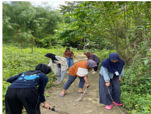
Gambar 21. Membersihkan jalan menuju tempat wisata Air Terjun Hulua

Kegiatan membersihkan lingkungan tidak hanya dilakukan di sekitar lingkungan pemukiman masyarakat tetapi juga dilakukan di sekitar tempat menuju lokasi Wisata Air Terjun Hulua yang masuk dalam wilayah Desa Ilohuwa.