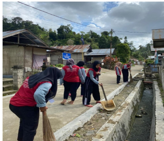
Gambar 19. Kegiatan Jumat Bersih di lingkungan pemukiman masyarakat desa Ilohuuwa

Kegiatan disekitar pemukiman masyarakat juga dilakukan dalam bentuk kegiatan rutin Jumat Bersih. Kegiatan ini dilakukan oleh seluruh mahasiswa KKN agar dapat menjaga kebersihan lingkungan sekitar seperti lingkungan Masjid, Sekolah, Kantor Desa, lingkungan sekitar sungai, dan area pemukiman masyarakat. Program ini berdampak positif dan mendapat antusias dari masyarakat setempat.