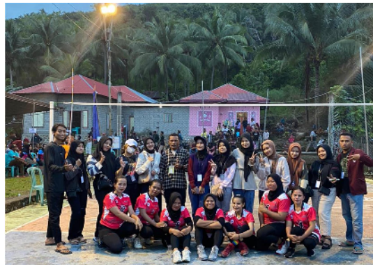
Gambar 14. Mahasiswa KKN ikut meghadiri pertandingan boal voli di Desa Ilohuuwa

Keterlibatan Mahasiswa KKN dalam bidang olahraga dan termasuk juga kegiatan desa adalah ikut berperan dalam kegiatan pertandingan bola voli yang diadakan di Desa Ilohuuwa pada tanggal 20 Juli 2023.