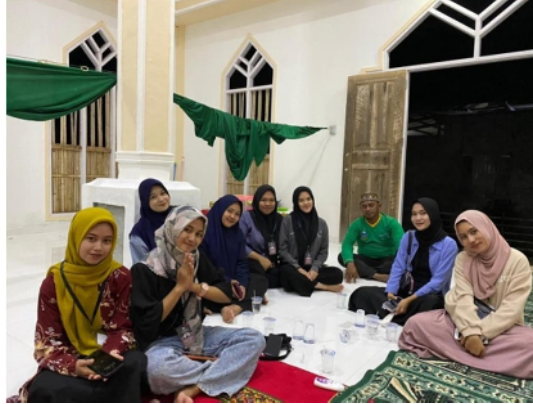
Gambar 33. Mahasiswa KKN bersama dengan Ayahanda desa Ilohuuwa dalam perayaan 10 Muharram di desa Masjid Al Muhtadin

Kegiatan lainnya adalah ikut serta dalam perayaan 10 Muharam yang dilakukan oleh masyarakat setempat di dusun 3 Desa Ilohuuwa. Kegiatan tersebut dilaksanakan di Masjid Al Muhtadin