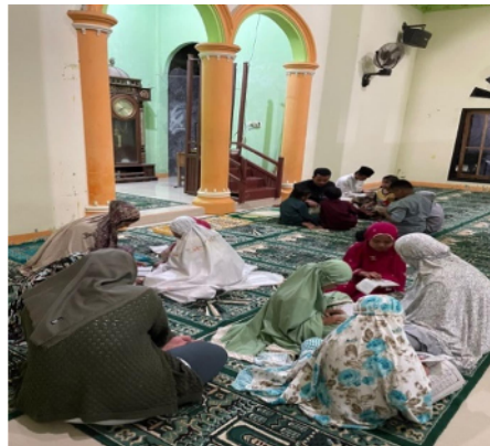
Gambar 32. Mbersamai anak-anak warga masyarakat dalam baca Quran

Kegiatan mahasiswa KKN dalam bidang kerohanian Islam adalah membimbing mengaji anak-anak Desa Ilohuuwa di Masjid As-Shabirin dusun 1 Mekar Jaya.