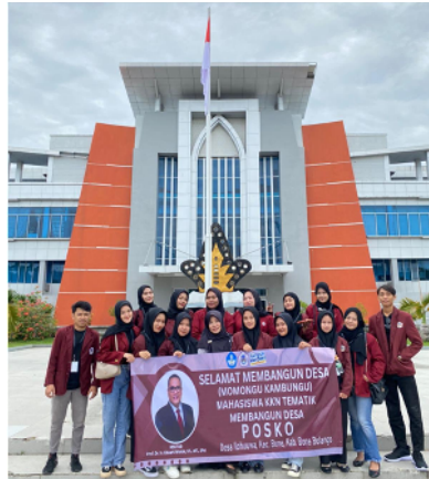
Gambar 2. Foto bersama DPL dan Mahasiswa KKN sebelum berangkat ke lokasi

Mahasiswa KKN ke lokasi Desa Ilohuwa Kecamatan Bone Kabupaten Bone Bolango. Pelepasan mahasiswa KKN dilaksanakan di halaman Kantor Rektorat UNG pada tanggal 18 Juli 2023. Mahasiswa KKN berjumlah 17 orang, yakni laki-laki 3 orang dan perempuan 14 orang.