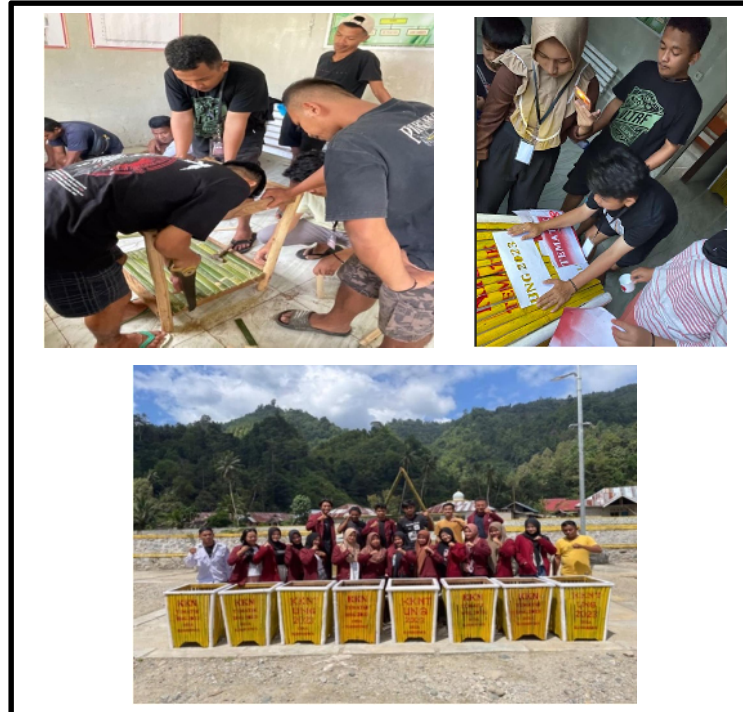
Gambar 22. Proses pembuatan tempat sampah

Kegiatan desa lainnya seperti rapat musyawarah desa, penetapan SDGs desa 2023 dan Rumbuk Stunting desa Ilohuuwa 2023.