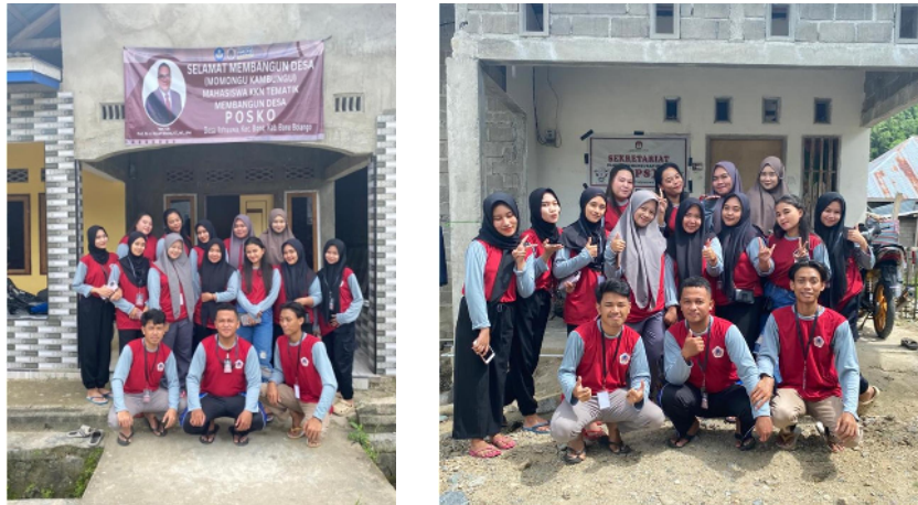
Gambar 4. Posko 1 (Posko Induk) dan Posko 2

Setelah kegiatan penerimaan Mahasiswa KKN Tematik Universitas UNG selesai, dilanjutkan survei ke posko yang akan ditempati Mahasiswa KKN. Survei ke posko didampingi langsung oleh ayahanda kepala desa dan aparat desa. Jumlah posko yang ditempati Mahasiswa KKN adalah dua rumah masyarakat yang letaknya berdekatan dengan kantor desa Ilohuuwa.