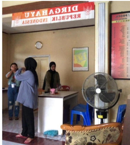
Gambar 13. Melakukan jadwal piket di Kantor Desa Ilohuuwa

Keterlibatan Mahasiswa KKN dalam bidang olahraga dan termasuk juga kegiatan desa adalah ikut berperan dalam kegiatan pertandingan bola voli yang diadakan di Desa Ilohuuwa pada tanggal 20 Juli 2023.