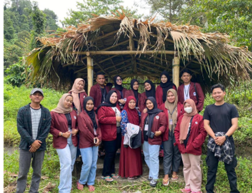
Gambar 28. Hasil jadi gerbang masuk

Setelah memasuki gerbang masuk lokasi air terjun, jalan menuju air terjun mulai menaiki anak tangga, posisi tempat duduk yang dibuat mahasiswa KKN berada persis dipuncak sebelum menuruni anak tangga ke Air Terjun. Tempat duduk yang dibuat selain sebagai tempat singgah juga berfungsi sebagai Spot Foto.