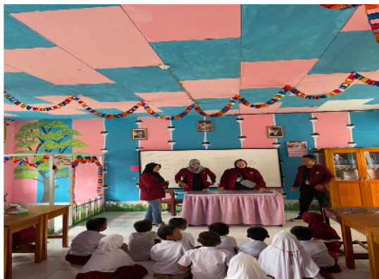
Gambar 34. Mahasiswa KKN mengajar di sekolah

Program bidang pendidikan mengajar di sekolah juga dilakukan mahasiswa KKN, yaitu menjadi tenaga pengajar di SD Negeri 7 Bone. Program ini merupakan sarana pembelajaran bagi mahasiswa dalam menyampaikan pengetahuan yang didapatkan selama pembelajaran di dalam kelas. Mahasiswa menyampaikan beberapa pelajaran seperti bahasa Inggris, PKN, Matematika.