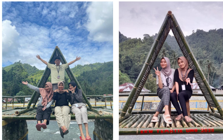
Gambar 8. Spot Foto di Lokasi Tanggul Ilohuwa

Hasil akhir dari pembuatan Spot Foto diharapkan dapat dikembangkan oleh masyarakat Desa Ilohuwa dengan membuat Spot Foto lainnya yang dapat ditempatkan di lokasi yang memiliki pemandangan indah. Tujuan dari pembuatan Spot Foto adalah untuk menarik wisatawan berkunjung ke Desa Ilohuwa yang dapat menunjang peningkatan perekonomian masyarakat dari berbagai aspek.