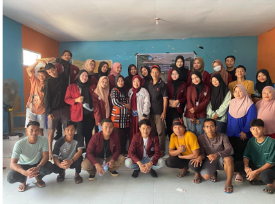
Gambar 9. Foto bersama setelah kegiatan pelatihan selesai