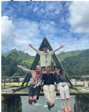
Gambar 4. Spot Foto di Lokasi Tanggul Ilohuuwa

Hasil akhir dari pembuatan Spot Foto diharapkan dapat dikembangkan oleh masyarakat Desa Ilohuuwa dengan membuat Spot Foto lainnya yang dapat ditempatkan di lokasi yang memiliki pemandangan indah. Tujuan dari pembuatan Spot Foto adalah untuk menarik wisatawan berkunjung ke Desa Ilohuuwa yang dapat menunjang peningkatan perekonomian masyarakat dari berbagai aspek.