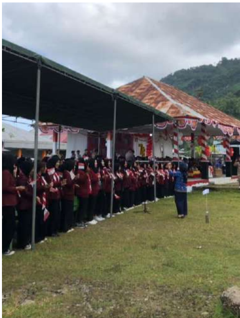
Gambar 19. Kegiatan Upacara Bendera 17 Agustus 2023

Selanjutnya, kegiatan pengabdian mahasiswa KKN di Desa Taludaa juga diisi dengan kegiatan merayakan HUT RI yang ke 78. Kegiatan upacara bendera dilaksanakan di lapangan RTH Taludaa dengan dihadiri oleh aparat se kecamatan Bone. Berikut dokumentasi yang dapat disajikan.