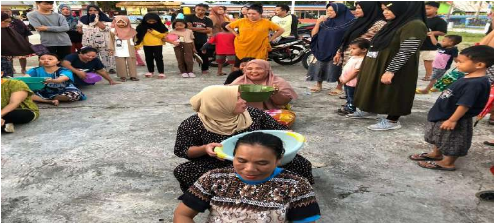
Gambar 22. Berbagai Kegiatan Lomna lainnya untuk Memerihkan HUT RI ke 78