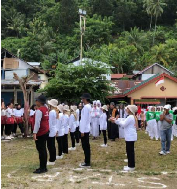
Gambar 20. Kegiatan Lomba Gerak Jalan HUT RI ke-78

Pada tanggal 17 Agustus 2023 masih dengan tema 17 Agustus 2023, dilaksanakan kegiatan tambahan berupa lomba gerak jalan yang diikuti oleh mahasiswa peserta KKN untuk memeriahkan HUT RI yang ke 78. Berikut gambar yang dapat disajikan.