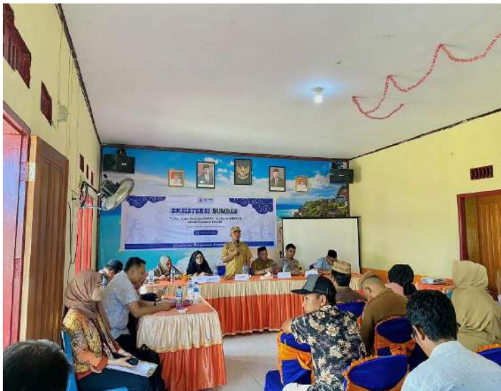
Gambar 16. Edukasi Kepada Masyarakat Tentang Bumdes

Selain kegiatan tambahan, KKN Tematik di Desa Taludaa ini terdapat satu kegiatan inti tentang Bumdes. Kegiatan ini dilaksanakan pada tanggal 15 Agustus 2023. Kegiatan inti “Bimtek Literasi Keuangan Bumdes yaitu tentang Tata Kelol Bumdes, Literasi Keuangan Bumdes dan Pemasaran Bumdes. Pelaksanaan kegiatan pelatihan dilakukan di kantor desa Taludaa yang dihadiri oleh Kepala Desa Taludaa, aparat desa dan masyarakat setempat termasuk pengelola Bumdes Zansibar yang terdapat di Desa Taludaa.