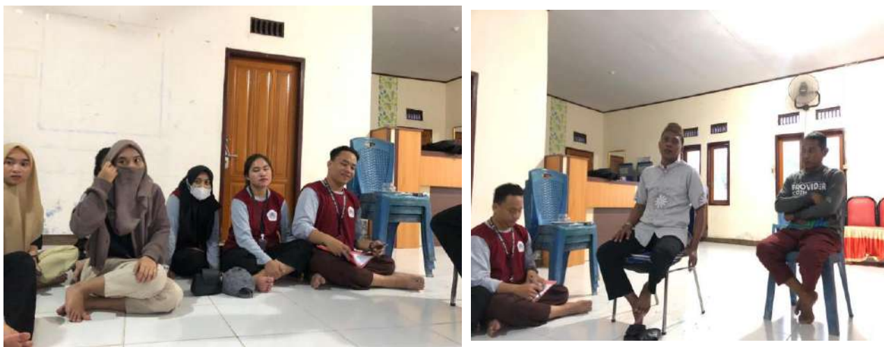
Gambar 7 Kegiatan Evaluasi Kegiatan KKN bersama DPL

Pada Jumat tanggal 21 Agustus 2023 dilaksanakan kegiatan monev oleh DPL. Dalam kegiatan monev juga membahas rencana kerja program inti dan tambahan penunjang selain monitoring pelaksanaan kegiatan tambahan yang telah terlaksana serta kendala yang dihadapi oleh masrakat dalam melaksanakan kegiatan pengabdian. Alhamdulillah tidak terdapat kendala dalam pelaksanaan kegiatan penunjang di Desa Taludaa bagi mahasiswa peserta KKN.