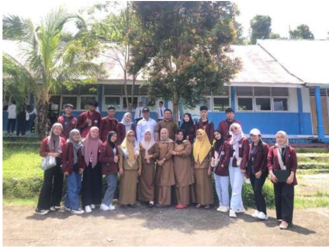
Gambar 12 Edukasi Pentingnya Bersosial Media Dengan Bijak

Dalam program penunjang KKN di Desa Taludaa dilaksanakan edukasi tentang materi ice breaking pada siswa SMPN 1 Bone Bolango. Kegiatan ini bertujuan untuk menanamkan kesadaran kepada siswa akan pentingnya bersosial media secara baik serta bahaya cyber bullying.