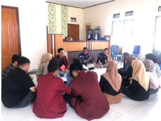
Gambar 8 Kegiatan Musyawarah Pelaksanaan Kegiatan penunjang

Selasa, 25 Juli 2023 dilaksanakan rapat kegiatan penunjang lainnya membahas program kerja tambahan, diantaranya pembenahan infrastruktur (gapura), repaint kembali batas desa dan sosialisasi tentang literasi digital.