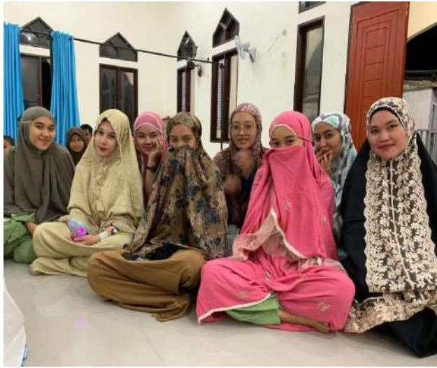
Gambar 4 Kegiatan 1 Muharran di Desa Taludaa