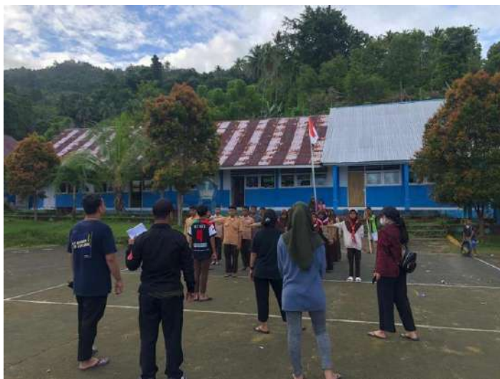
Gambar 14 Pelatihan Ekstrakurikuler Pramuka Kepada Siswa SMPN 1 Bone

Gambar 13 menunjukkan tentang kegiatan mahasiswa KKN di Desa Taludaa terkait pendataan infografis pada masyarakat. Adapun tujuan dari kegiatan ini adalah untuk memperoleh data penduduk dan kondisi wilayah Desa Taludaa sebagai kebutuhan pembuatan video profil desa