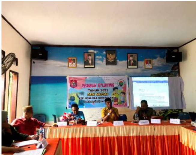
Gambar 9 Kegiatan Musyawarah tentang Rencana Pelaksanaan Sosialisasi Stunting

Pada hari Kamis, tanggal 27 Juli 2023 diadakan kegiatan sosialisasi rembuk Stunting di Kantor Desa Taludaa. Adapun tujuan dari kegiatan ini adalah untuk mempersiapkan tempat dan keikutsertaan dalam sosialisasi stunting pada masyarakat sebagai program dalam kegiatan desa.