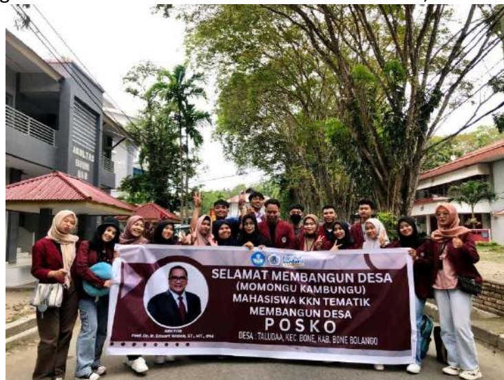
Gambar 2. Pengantaran Mahasiswa Peserta KKN ke Lokasi KKN, Desa Taludaa

Dalam pelaksanaan coaching, mahasiswa juga diberikan pembekalan tentang etika yang harus dijunjung tinggi oleh mahasiswa dalam pelaksanaan KKN. Alhamdulillah pelaksanaan coaching berjalan dengan baik dan mahasiswa memahami dengan materi pembekalan yang telah diberikan. Setelah dilaksanakan tahapan pembekalan, selanjutnya adalah tahapan pemberangkatan ke lokasi KKN. Berikut gambar disajikan pada saat pengantaran dan penerimaan mahasiswa KKN di Desa Taludaa.