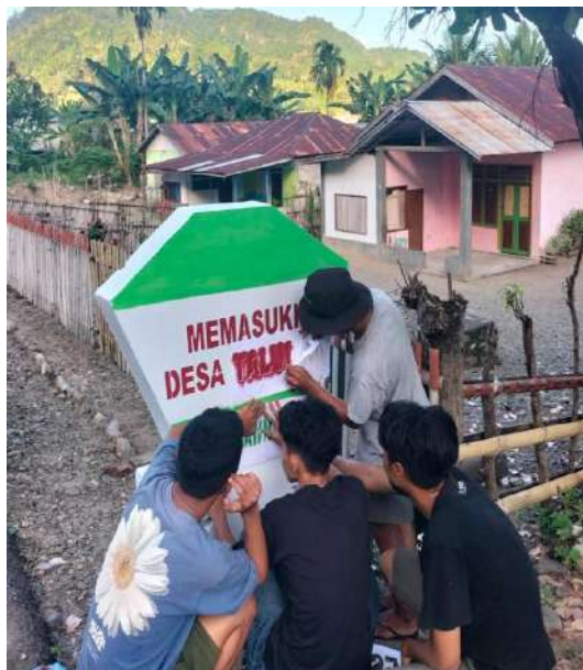
Gambar 15 Renovasi Gapura Batas Desa

Diantara deretan kegiatan mahasiswa peserta KKN yang begitu pada, terdapat kegiatan Repair batas desa bersama dengan karang taruna di Rumah Adat Desa Taludaa. Kegiatan ini dilaksanakan pada hari Senin, tanggal 7 Agustus 2023 yang bertujuan untuk memperbaiki dan merepain kembali batas desa.