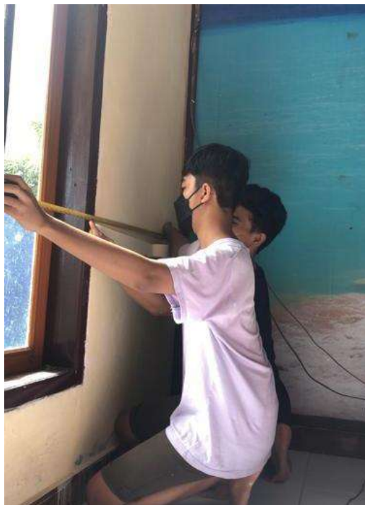
Gambar 11 Kegiatan Perayaan 10 Muharram

Kegiatan penunjang lainnya dilakukan pada hari Sabtu, tanggal 29 Juli 2023, yaitu pembersihan kantor desa Taludaa. Pembersihan termasuk kegiatan pengecatan kembali dan penataan ulang ruangan kantor Desa taludaa untuk persiapan penyambutan 17 Agustus 2023.