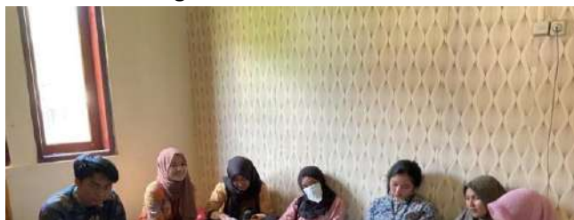
Gambar 17. Kegiatan Monev Oleh DPL

Setelah kegiatan inti dilaksanakan pada tanggal 15 Agustus juga dilakukan kegiatan monev oleh Tim DPL untuk mengevaluasi seluruh kegiatan yang telah dilaksanakan oleh mahasiswa peserta KKN. Selain evaluasi kegiatan yang telah terlaksana, kegiatan monev juga ditujukan untuk menggali berbagai kendala yang dihadapi oleh tim pengabdian dalam menjangkau solusi bagi permasalahan-permasalahan desa. Kegiatan monev juga dilakukan untuk mengikuti jejak yang akan diletakkan pada kegiatan-kegiatan penunjang lainnya yang telah direncanakan hingga proses penarikan dilakukan pada waktu yang telah ditentukan.