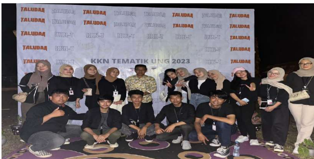
Malam Perpisahan Mahasiswa Peserta KKN di Desa Taludaa