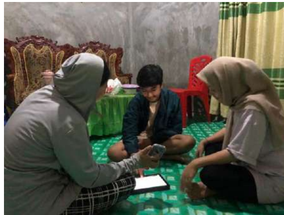
Gambar 18. Kegiatan Publikasi Kegiatan Inti KKN Di Desa Taludaa

Selanjutnya, kegiatan pengabdian mahasiswa KKN di Desa Taludaa juga diisi dengan kegiatan merayakan HUT RI yang ke 78. Kegiatan upacara bendera dilaksanakan di lapangan RTH Taludaa dengan dihadiri oleh aparat se kecamatan Bone. Berikut dokumentasi yang dapat disajikan.