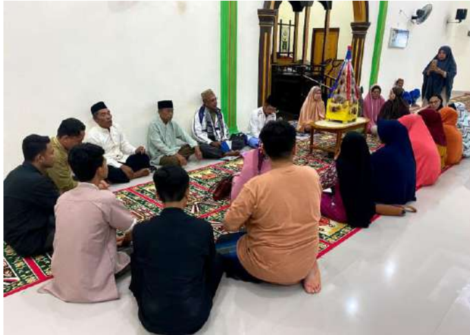
Gambar 10 Kegiatan Perayaan 10 Muharram

Dan di tanggal 28 juli 2023 dilaksanakan perayaan 10 Muharram bersama masyarakat setempat berlokasi di Masjid Desa Taludaa.