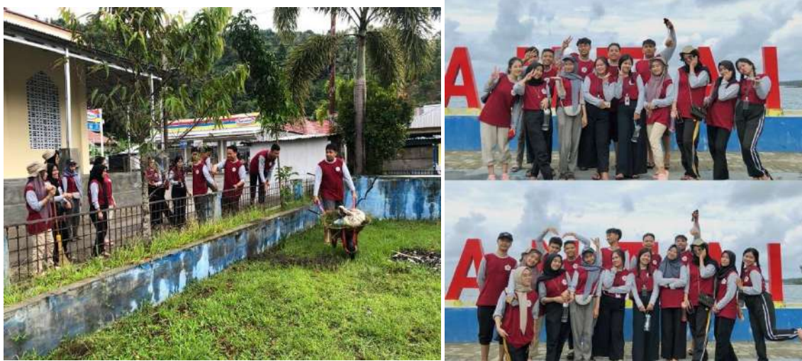
Gambar 6 Kegiatan Jumat Bersih

Pada Jumat tanggal 21 Agustus 2023 dilaksanakan kegiatan monev oleh DPL. Dalam kegiatan monev juga membahas rencana kerja program inti dan tambahan penunjang selain monitoring pelaksanaan kegiatan tambahan yang telah terlaksana serta kendala yang dihadapi oleh masrakat dalam melaksanakan kegiatan pengabdian. Alhamdulillah tidak terdapat kendala dalam pelaksanaan kegiatan penunjang di Desa Taludaa bagi mahasiswa peserta KKN.