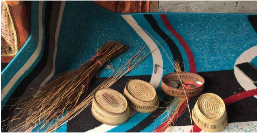
Gambar 21. Menggali lebih Dalam Tentang Kopiah Karanji Khas Gorontalo