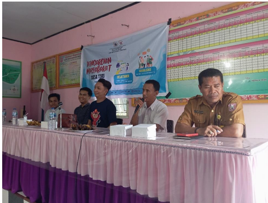
Gambar 5.1. Sosialisasi dan Pelatihan kegiatan digitaliasi UMKM Desa Tihu

Kegiatan ini dilaksanakan di lingkungan Desa Tihu yaitu dengan cara mengadakan pertemuan bersama aparat desa dan masyarakat, dengan tujuan untuk memberitahukan masyarakat mengenai kegiatan yang akan dilaksanakan berupa sosialisasi dan pelatihan digitalisasi UMKM. Sosialisasi dan Pelatihan dilakukan pada warga-warga pemilik UMKM yang berada pada lingkungan Desa Tihu. Dalam pelaksanaannya terdapat kendala yaitu beberapa palaku UMKM tidak dapat kami sosialisasikan dikarenakan sedang ada keperluan di luar rumah sehingga tidak dapat menghadiri pertemuan tersebut. Akan tetapi hal tersebut dapat diatasi dikarenakan bantuan dari kepala desa yang juga membantu dalam menyampaikan kepada masyarakat.