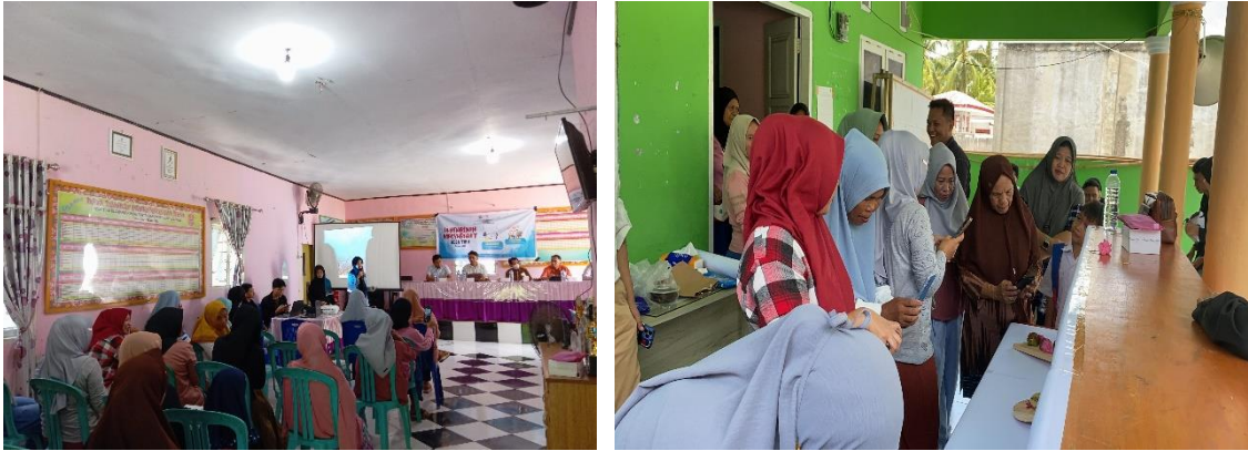
Gambar 5.2 Peserta Sosialisasi kegiatan Pelatihan digitalisasi UMKM (foto produk umkm) di Desa Tihu

Hasil dari kegiatan pengabdian kepada masyarakat di Desa Tihu mencerminkan dampak positif yang signifikan dalam mengatasi permasalahan yang diidentifikasi. Pertama, terdapat peningkatan yang nyata dalam keterampilan fotografi produk para pelaku UMKM. Foto produk yang dihasilkan menjadi lebih profesional, menarik, dan meningkatkan daya saing produk lokal di pasar digital.