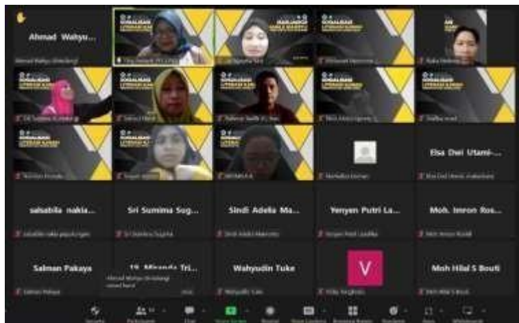
Gambar 1.1 Dokumentasi kegiatan pada bulan Mei tahun 2023

Seperti yang dipaparkan sebelumnya bahwa bahwa masyarakat Indonesia mempunyai kecenderungan mengakses sosial media rata-rata 9 jam per hari. Youtube merupakan salah satu sosial media yang populer dan banyak di akses oleh anak muda. Berdasarkan laporan We Are Social dan Hootsuite 2023 yang dimuat dalam media online GoodStats Youtube menjadi platform ke dua dengan pengguna aktif terbanyak di tahun 2023 Naurah (2023). Kemudian melihat rendahnya minat baca mahasiswa di beberapa fakultas dan jurusan di Universitas Negeri Gorontalo, diperlukan usaha untuk menumbuhkan minat baca tersebut di tengah gencatan arus digital. Usaha yang akan dilakukan adalah melalui ulasan 1 minggu 1 buku yang dimuat dalam bentuk konten Youtube. Ulasan buku akan memberikan anak muda wawasan tentang buku-buku baru dan menarik yang mungkin belum mereka ketahui sebelumnya. Konten itu membantu mereka menemukan judul-judul yang relevan dengan minat. Kemudian Konten ulasan buku dapat memberikan inspirasi untuk membaca. Anak muda dapat merasa tertarik untuk menjelajahi dunia buku berdasarkan rekomendasi ulasan yang mereka baca.