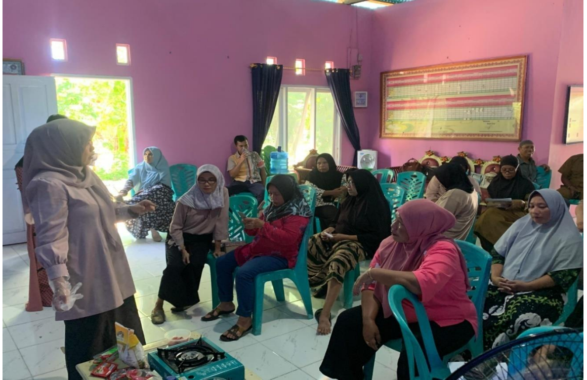
Gambar 3 : Pemberian Edukasi Ekonomi Kreatif oleh Pemateri

Peserta pelatihan akan mendapatkan pengetahuan yang cukup yang selanjutnya diharapkan dapat diimplementasikan dalam kegiatan sehari-hari masyarakat Desa Botutonuo.