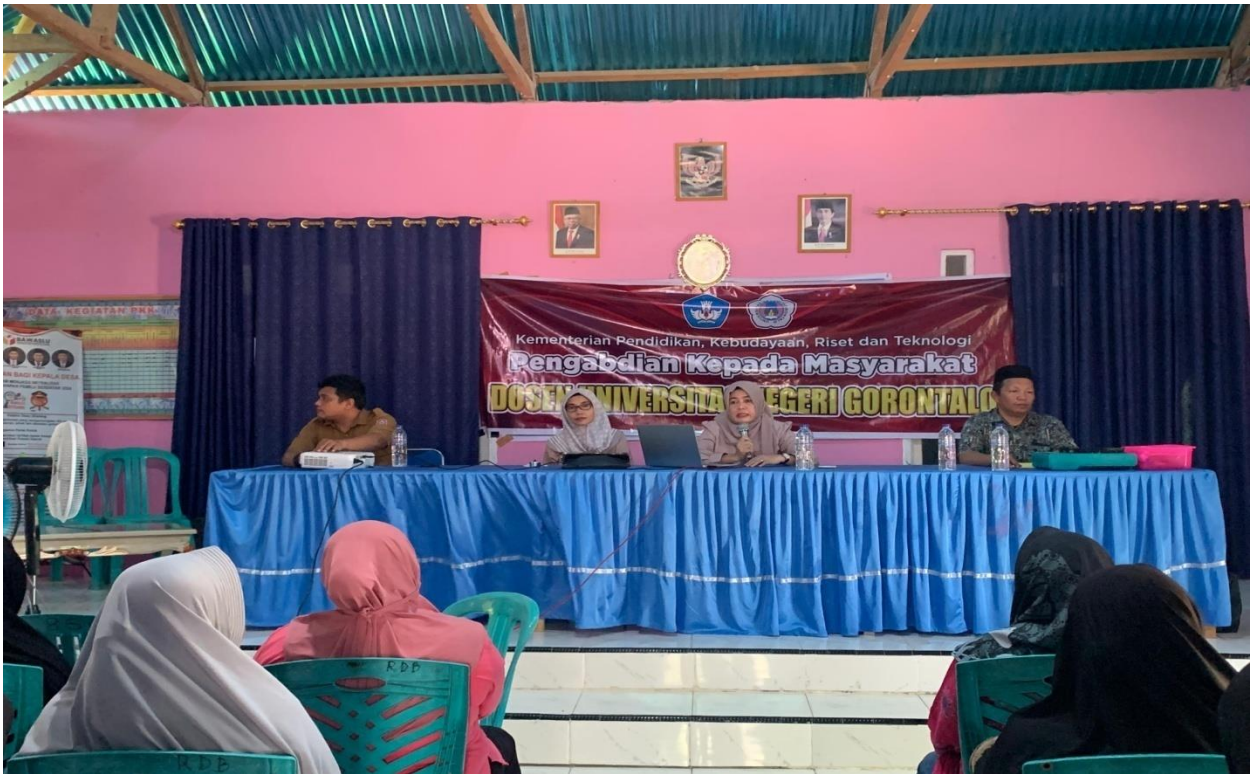
Gambar 2. Kegiatan Pengabdian Pemberian Kepada Masyarakat

Pada tahap ini diawali dengan pengucapan syukur dan terima kasih dari kepala desa kepada Tim Pengabdian Masyarakat UNG melalui kata sambutan yang disampaikan pada tahap ini. Selanjutnya dari ketua menyampaikan kata sambutan dan tujuan pelaksanaan kegiatan pengabdian masyarakat ini.