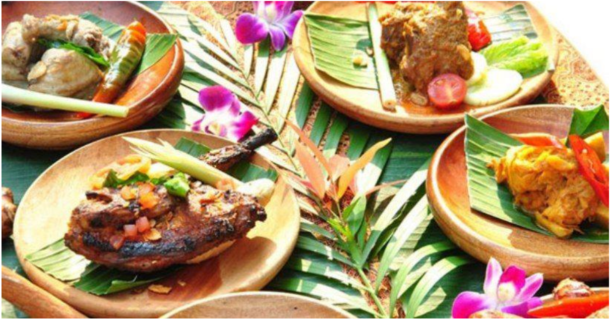
Gambar 4 : Pemaparan Contoh Ekonomi Kreatif kuliner oleh Pemateri

Setelah proses edukasi pemberian materi dan dilanjutkan pelatihan penerapan Ekonomi kreatif kepada masyarakat desa Bututonuo Kecamatan Kabila Bone Kabupaten Bone Bolango diharapkan tujuan dari pelatihan ini dapat terwujud dan memberikan manfaat kepada masyarakat sehingga dapat diimplementasikan.