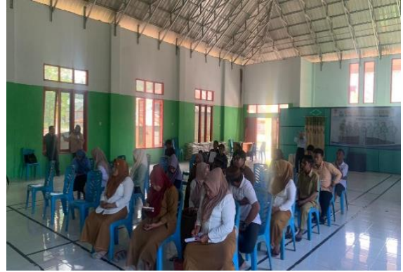
Gambar 2. Pelatihan Pembuatan Izin Usaha Berbasis OSS Untuk UMKMUusaha

Kegiatan inti lainnya adalah pembuatan wibesite. Kegiatan ini terkait dengan tindak lanjut fungsi website yang melalui tampilan, isi serta akses untuk masyarakat dalam menggunakan website sebagai sumber informasi desa. Pada tahapan ini mahasiswa meminta saran serta kritik kepada pemerintah desa maupun masyarakat yang telah menggunakan website desa ini, agar kami dapat memperbaiki permasalahan yang berada dalam website baik dari desain, fitur-fitur maupun pada aspek fungsi website nya. Pembuatan website desa ini diharapkan dapat memudahkan perangkat desa dalam mengelola data-data administrasi masyarakat, sehingga menjadikan website ini sebagai layanan publik yang mudah dan cepat, serta website desa ini sebagai media informasi yang akurat tentang desa.