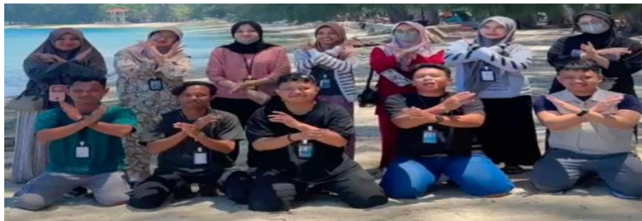
Gambar 1. Survei Lokasi