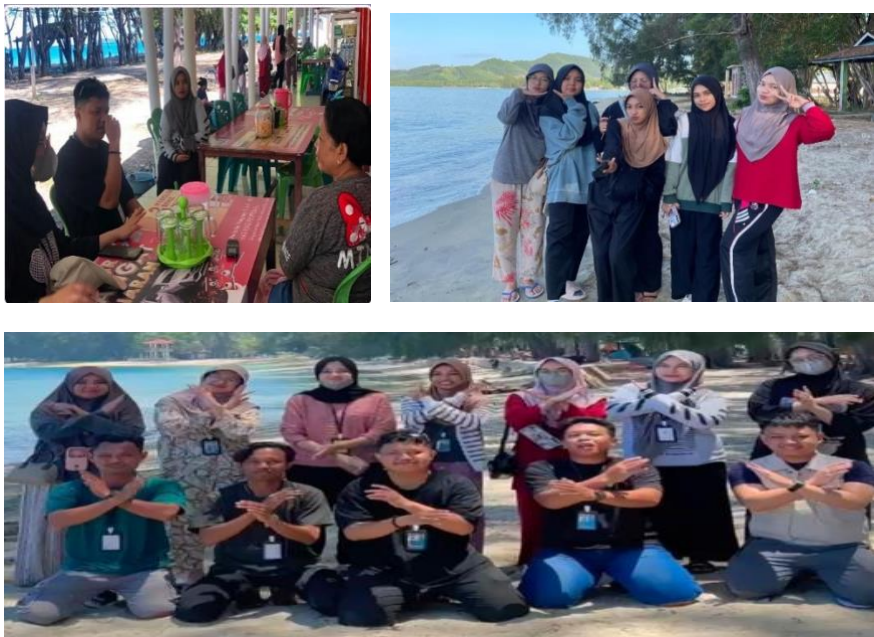
Gambar 1. Survei Lokasi

Dalam Mengidentifikasi potensi usaha wisata pantai di desa Bolihutuo dilakukan oleh mahasiswa dengan melakukan survei langsung ke lokasi wisata pantai tersebut yaitu dapat dilihat pada gambar di bawah ini: