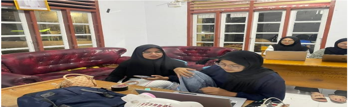
Gambar 3. Pembuatan Website

Dari kegiatan yang telah dilakukan tersebut diatas diharapkan masyarakat di desa Bolihutuo mampu Meningkatkan jumlah mitra sasaran dalam hal ini UMKM yang mampu menerapkan pengetahuan dan keterampilan dalam mengelolah usahanya seperti dengan memanfaatkan platform sosial media seperti Instagram, facebook dan platform digital lainnya seperti website informasi desa dan pembuatan izin usaha berbasis OSS. Berikutnya adalah peningkatkan kapasitas pengelolaan usaha wisata mitra UMKM serta meningkatnya jumlah dan ragam penggunaan teknologi digital.