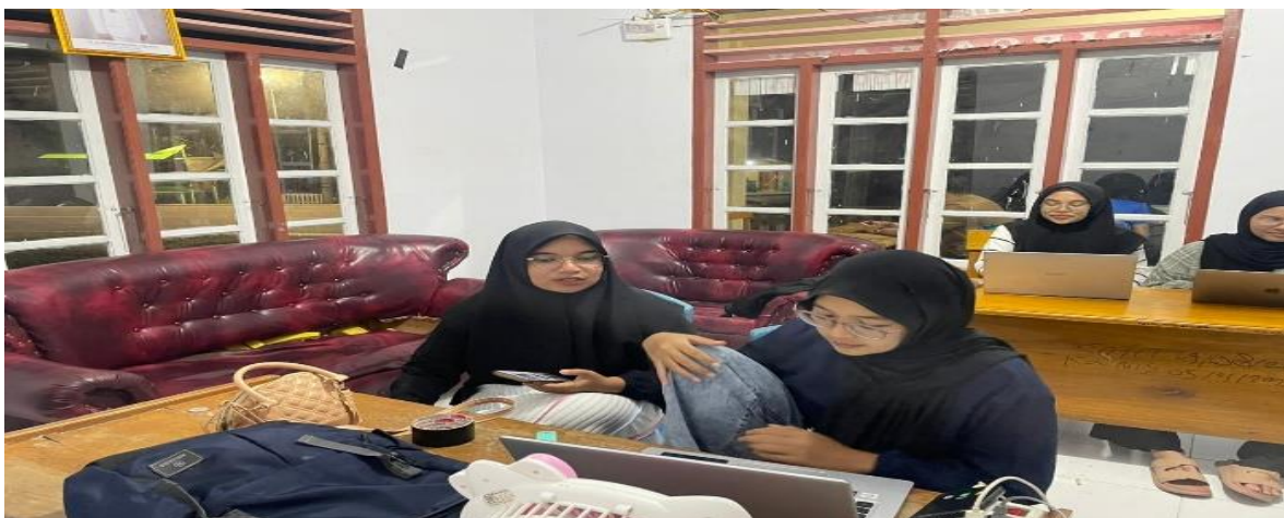
Gambar 3. Pembuatan Website

Dari kegiatan yang telah dilakukan tersebut diatas diharapkan masyarakat di desa Bolihutuo mampu Meningkatkan jumlah mitra sasaran dalam hal ini UMKM yang mampu menerapkan pengetahuan dan keterampilan dalam mengelolah usahanya seperti dengan memanfaatkan platform sosial media seperti Instagram, facebook dan platform digital lainnya seperti website informasi desa dan pembuatan izin usaha