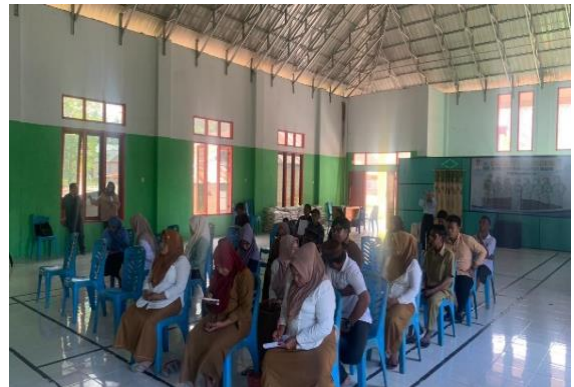
Gambar 2. Pelatihan Pembuatan Izin Usaha

Kegiatan inti lainnya adalah pembuatan wibesite. Kegiatan ini terkait dengan tindak lanjut fungsi website yang melalui tampilan, isi serta akses untuk masyarakat dalam menggunakan website sebagai sumber informasi desa. Pada tahapan ini mahasiswa meminta saran serta kritik kepada pemerintah desa maupun masyarakat yang telah menggunakan website desa ini, agar kami dapat memperbaiki permasalahan yang berada dalam website baik dari desain, fitur-fitur maupun pada aspek fungsi website nya. Pembuatan website desa ini diharapkan dapat memudahkan perangkat desa dalam mengelola data-data administrasi masyarakat, sehingga menjadikan website ini sebagai layanan publik yang mudah dan cepat, serta website desa ini sebagai media informasi yang akurat tentang desa.