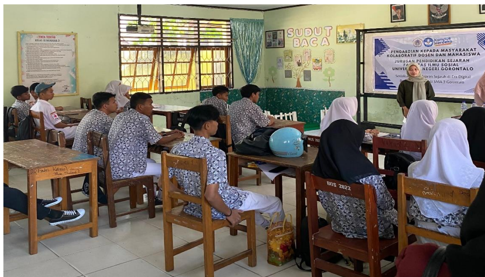
Pemaparan Materi oleh TIM