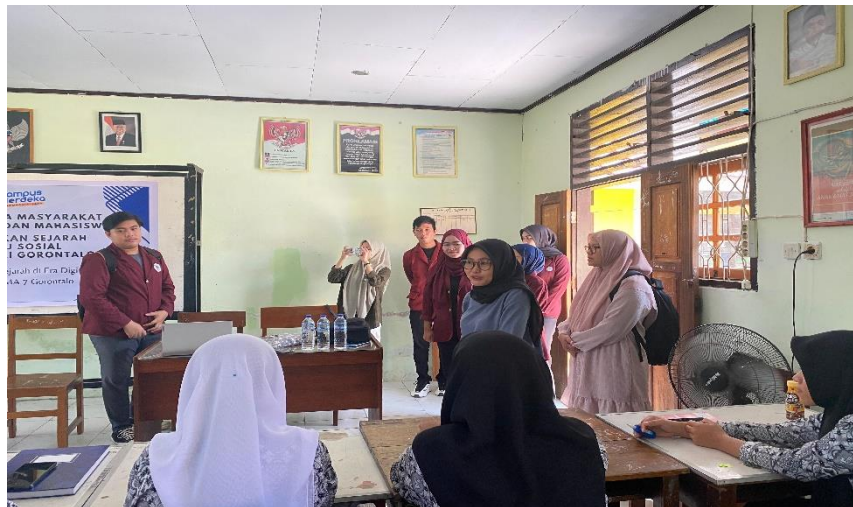
Pengkondisian peserta oleh TIM