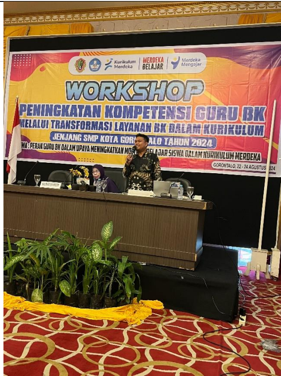
Gambar 3. Pelatihan Konseptual