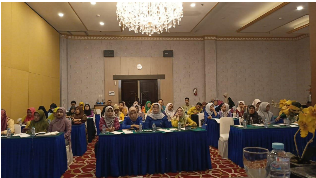
Gambar 4. Teknik Menyusun dan Mengolah ITP dan ATP

Guru BK dilatih menggunakan ITP dan ATP, mulai dari pengumpulan data, pengolahan data, hingga interpretasi hasil asesmen. Panduan teknis berupa manual dan video tutorial disediakan untuk membantu guru BK mengoperasikan instrumen asesmen secara mandiri. Sesi ini juga melibatkan simulasi langsung di mana guru BK melakukan asesmen pada kasus nyata dengan bimbingan ahli asesmen.